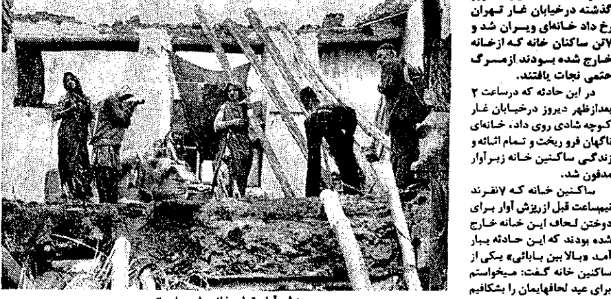
ریزش آوار تمام خانه را ویران کرد

در یک حادثه آوار که روز گذشته در خیابان غار تهران رخ داد خانه ای ویران شد و ۷ تن ساکنان خانه که از خانه خارج شده بودند از مرگ حتمی نجات یافتند. در این حادثه که در ساعت ۲ بعد از ظهر دیروز در خیابان غار کسوجه شادی روی داد، خانه ای ناگهان فرو ریخت و تمام اشانه و زندگی ساکنین خانه زیر آوار مدفون شد. ساکنین خانه که ۷ نفرند نجات یافتند. این حادثه در روز دوشنبه لحاف این خانه خارج شده بودند که این حادثه بیچاره ساکنین خانه گفت: میخواستیم برای عید لطافانمان را بکنیم و پس از ششسوی رویه و ساخته آن مجدداً آنرا بدویم. به همین خاطر به خانه همسایه رفتیم. در این موقع ناگهان صدای مهیبی بلند شد و هنگامیکه سرسایمه بیرون آمدم دیدم که خانه ام خراب شده است. او در حالیکه خدا را شکر میکرد گفت: اگر کسی در پرتو آفتاب بیرون آمده بودیم شاید همه ما کشته شده بودیم. مأموران نجات و امداد آتش نشانی که برای کمک به آمانی خانه بمحل رفته بودند پس از بررسی های لازم مجدداً به جایگاههای خود برگشتند.