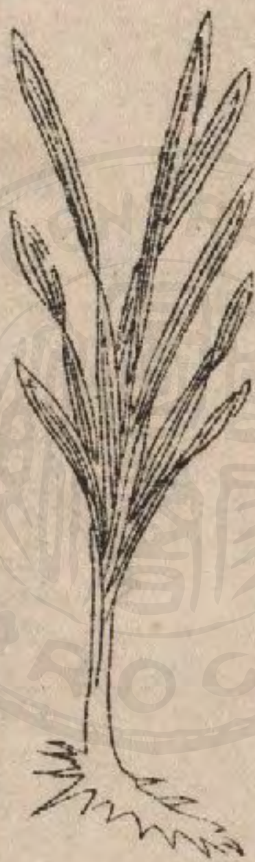
草 三 奈

草三奈 生密縣梁家衝山谷中。苗高一尺許。葉似蕺草而狹長。開小淡紅花。根似雞爪形而 觚。亦香。其味甘微辛。