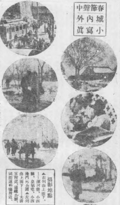
本報記者在各地所攝之小城內寫真，以供讀者一睹其概。此類照片，多係在抗戰期間，小城內之生活情形，及抗戰前線之情形，均極珍貴。本報特將此類照片，分刊於此，以供讀者一睹其概。