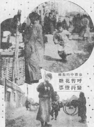
春呼聲 舊花 新筆 墨點

行市十日 銀價 中外匯兌 各地豆報 各地錢鈔 警察槍斃 搶 產出稅率 實業調查表