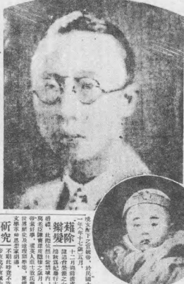
遜帝之今昔 (上) 登報時攝影