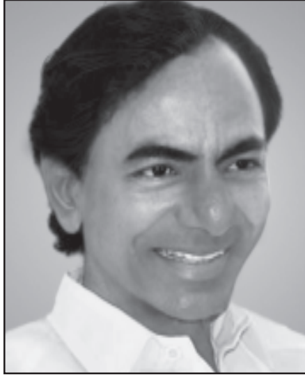
తెలంగాణ తొలి ముఖ్యమంత్రివర్యులు శ్రీ కల్వకుంట్ల చంద్రశేఖర్ రావు గారు