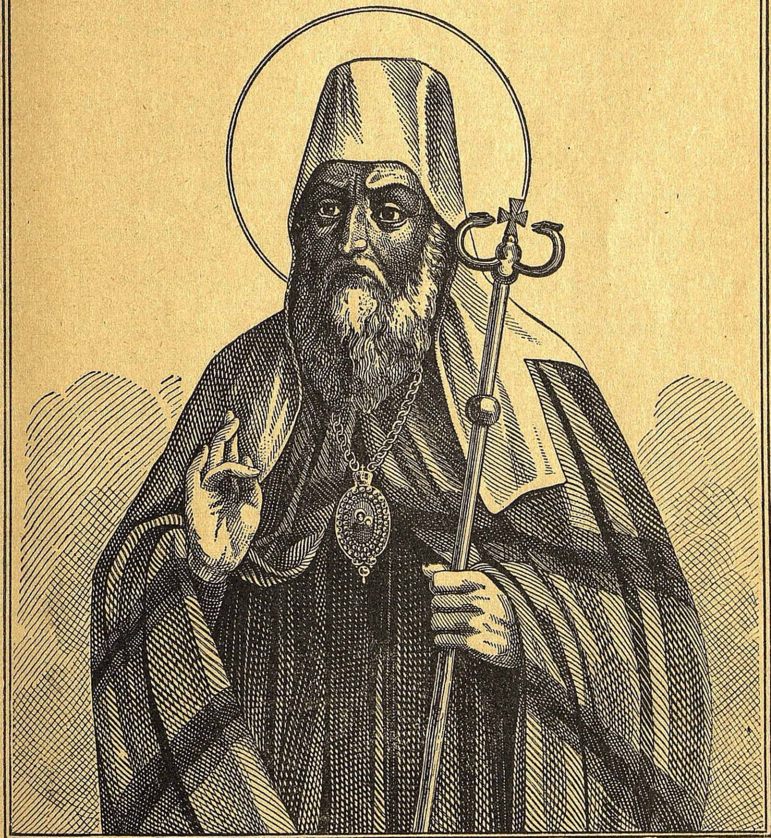
ЮАННЪ МАКСИМОВИЧЪ, МИТРОПОЛИТЪ ТОВОЛЬСКІЙ И ВСЕЯ СИБИРИ.