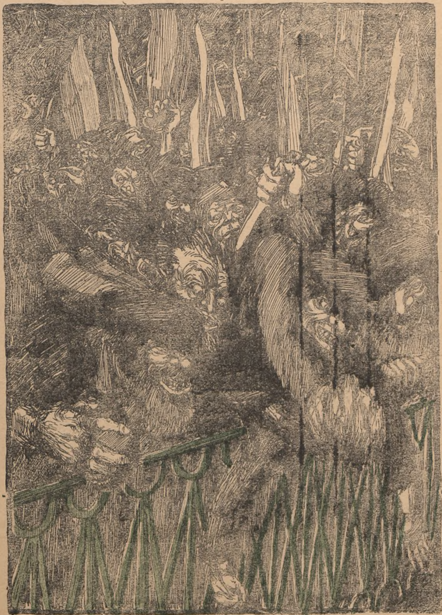
Матриотская демонстрация в Москве на Красной площади 22-го ноября 1905 года