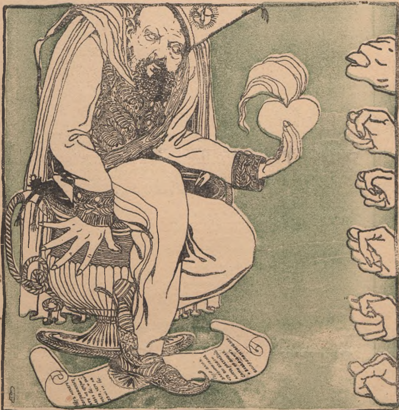
Магъ Витте сидящій на урнѣ благовоній въ знакъ политѣйшей расположенности и искреннѣйшаго добра къ кому-то, держитъ чье-то многострадальное сердце пы-