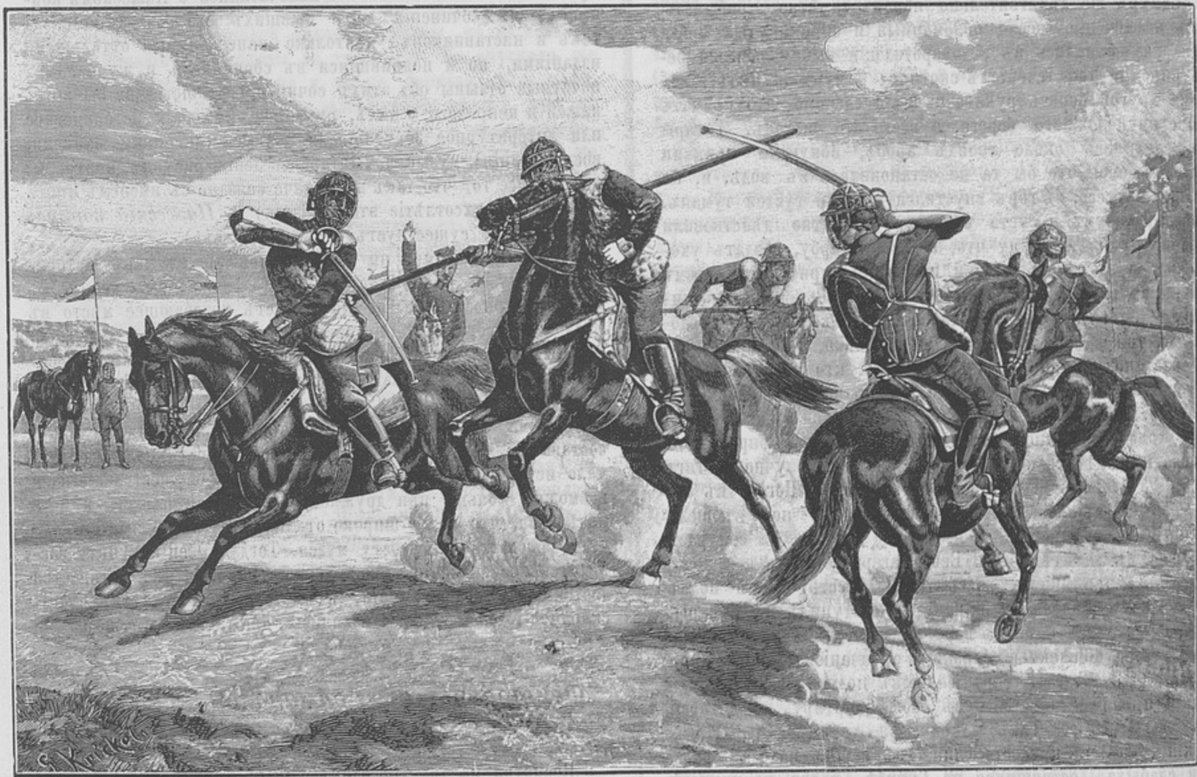
Къ статьѣ: «Фехтованіе въ Германской кавалеріи».

Это была обыкновенная голова, съ русыми волосами, вы-