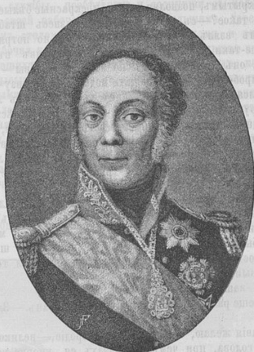
Гр. Ѡ. В. Ростопчинъ *).

1) Недостаетъ хотя бы весьма краткаго историческаго очерка появленія званія пажей въ Россіи и возникновенія Пажескаго корпуса, какъ учебнаго заведенія.