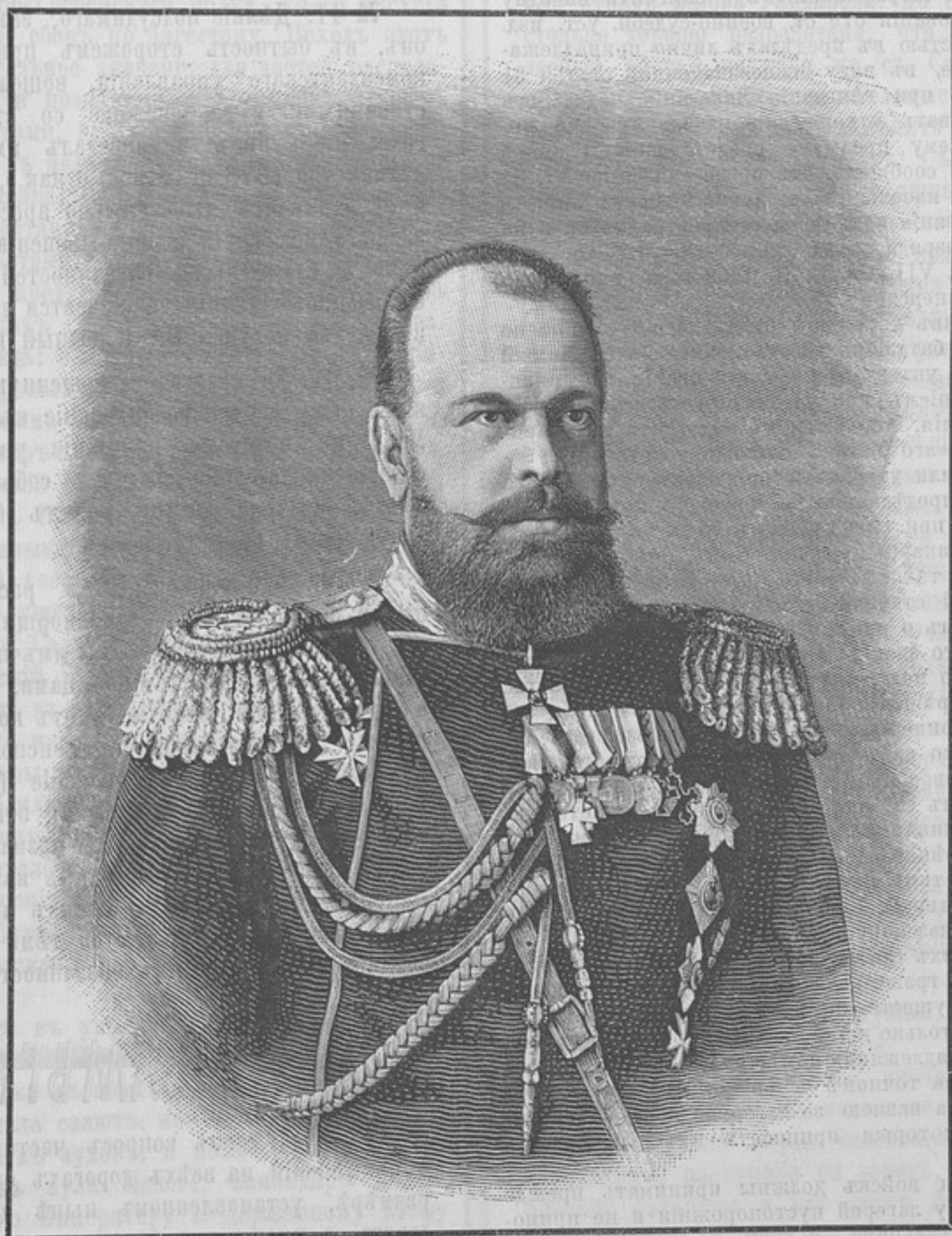
ИМПЕРАТОРЪ АЛЕКСАНДРЪ III.