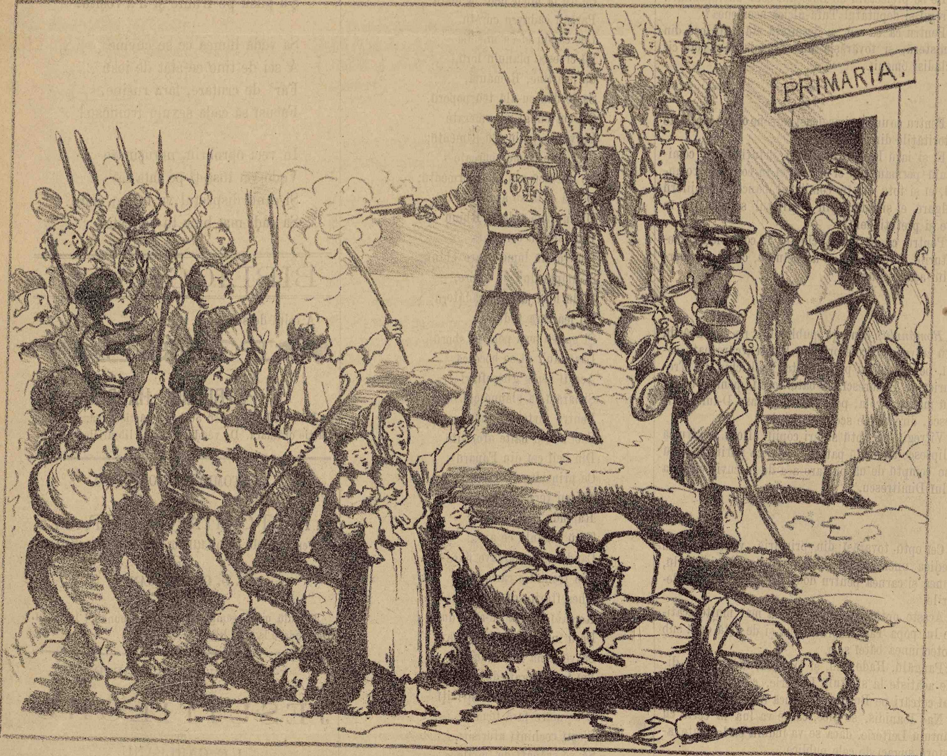
Fericirile grămădite pe capetele contribuabililorū. — Scenă petrecută la Giurgiu.