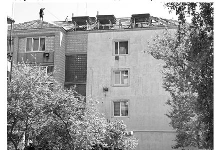
Інф. Макарівської селищної ради

Вдячні небайдужим благодійникам, що внесли вклад у відновлення пошкодженої громади.