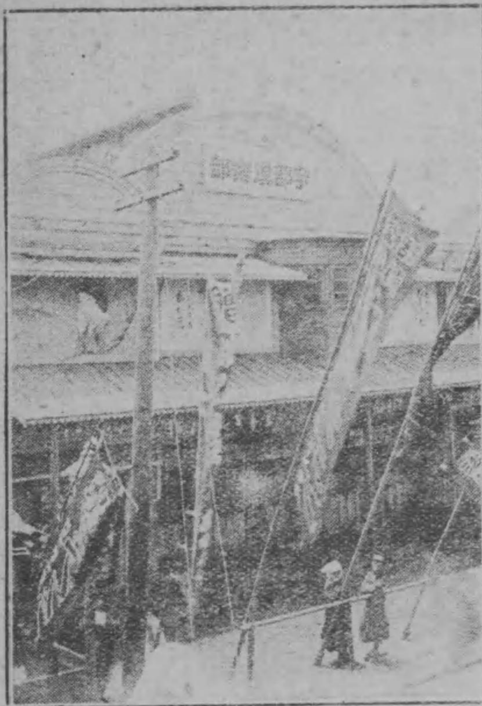
宇部俱樂部全部景