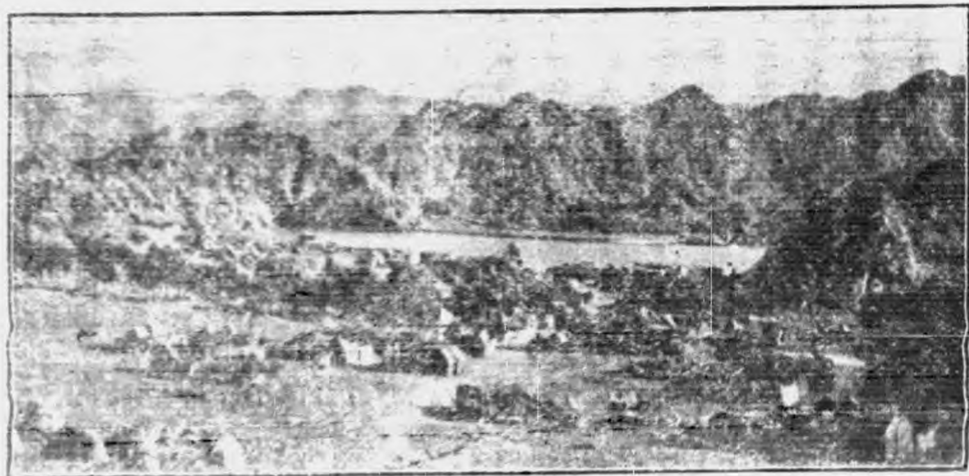
阿 拉 伯 風 景