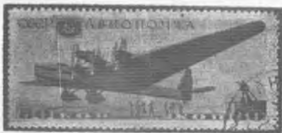
80K 藍紫色及棕色 blue violet & brown