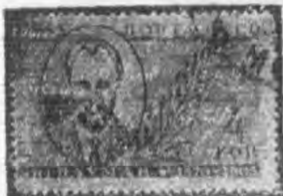
4K 棕紫色 brown violet