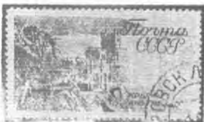
1r. 暗綠色 slate green.