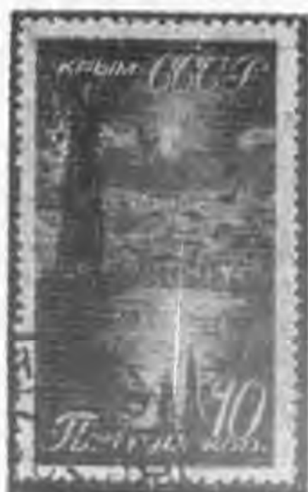
10K 棕色 brown