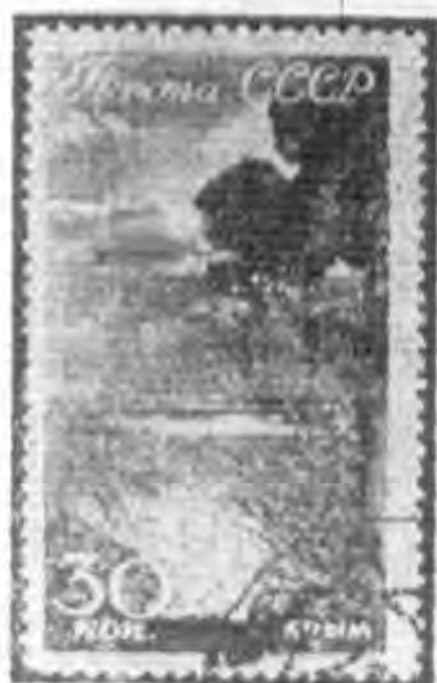
30K 黑棕色 black brown