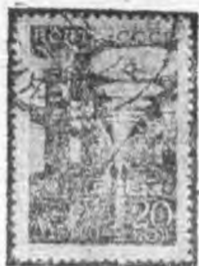
20K 黑棕色 black brown