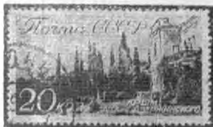
20K 暗棕色 dark brown