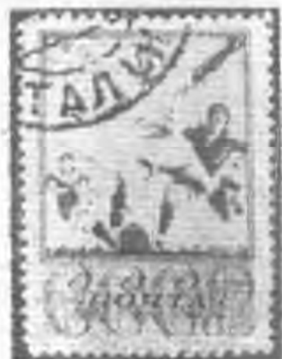
← 50K 藍色 blue