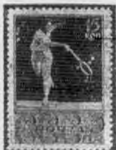
15K 棕色 brown