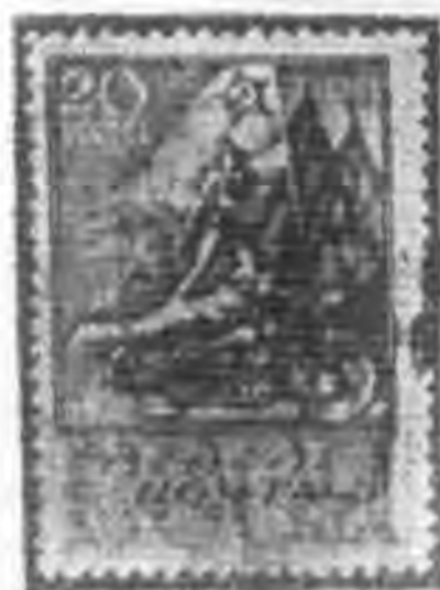
← 20K 綠色 green