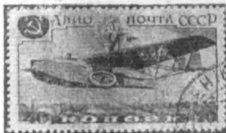
40K 紫棕色及黑色 violet brown & black