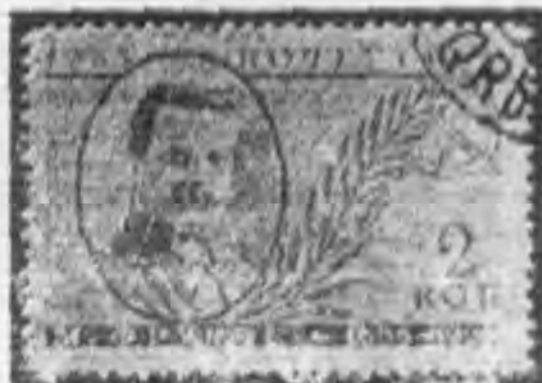
2K 紫色 purple

1935 Frunze, Baumann, Kirov. Memorial issue. (3) complete