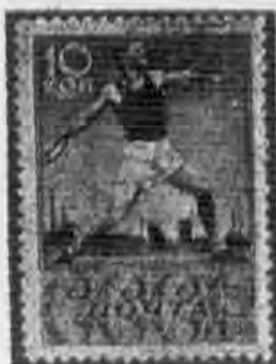
10K 黑色 black