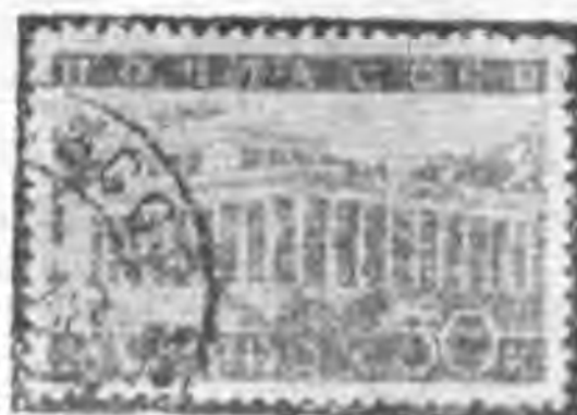
30K 暗紅紫羅蘭色 dark red violet