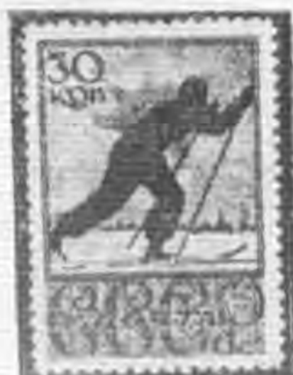
30K 暗紫羅蘭色 dull violet →