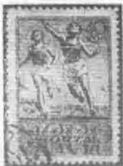
40K 深綠色 deep green