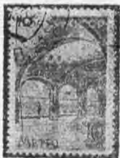
10K 深紅紫羅蘭色 deep red violet

1938 Inauguration of a New line of Moscow Subway issue (6) complete.