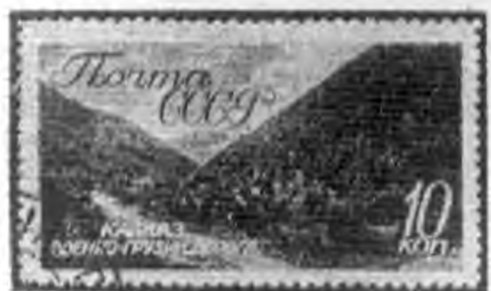
10K 暗綠色 Slate green