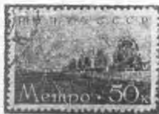
50K 暗棕色 dark brown