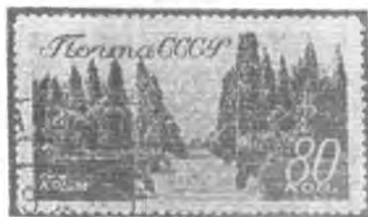
80K 棕色 brown