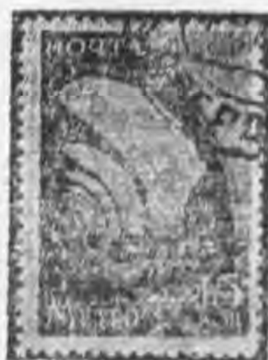
15K 暗棕色 dark brown