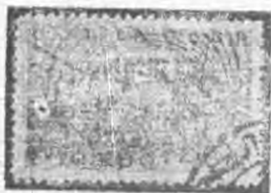
40K 黑棕色 black brown