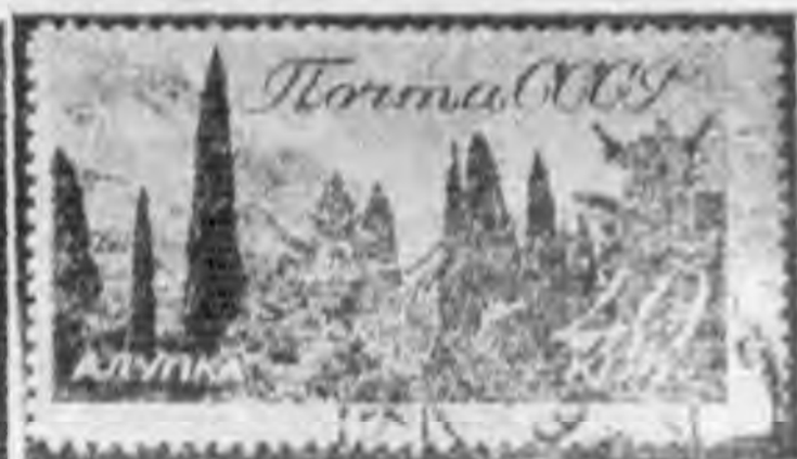
40K 棕色 brown