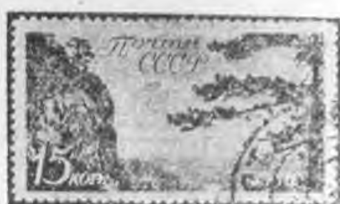
15K 黑棕色 black brown