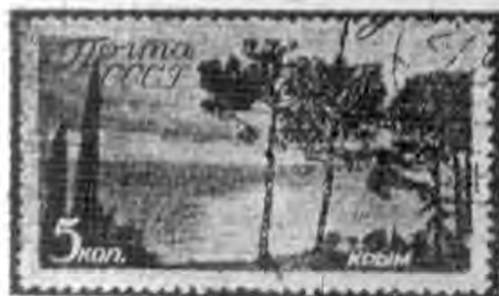
5K 棕色 brown