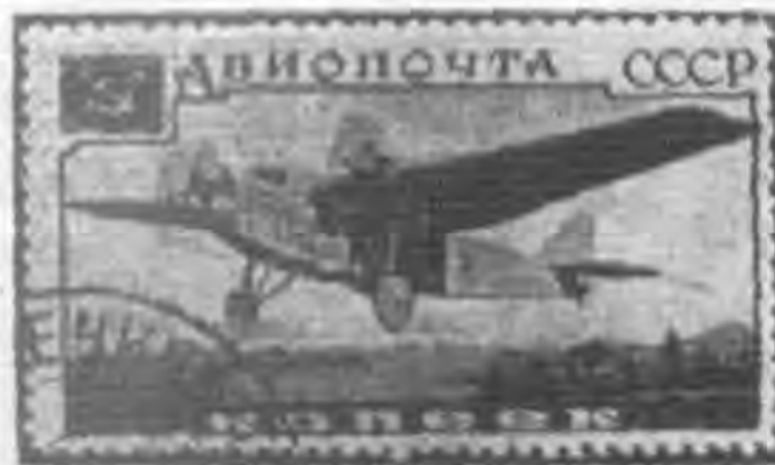
20K 灰綠色及黑色 gray green & black