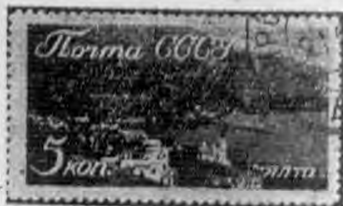
5K 黑棕色 black