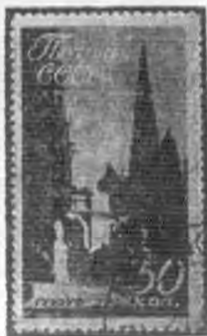
50K 深暗綠色 deep slate green