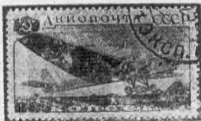
30K 紅棕色及黑色 red brown & black