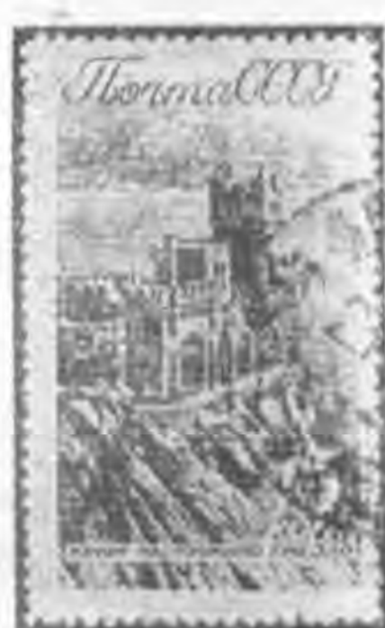
15K 暗棕色 dark brown