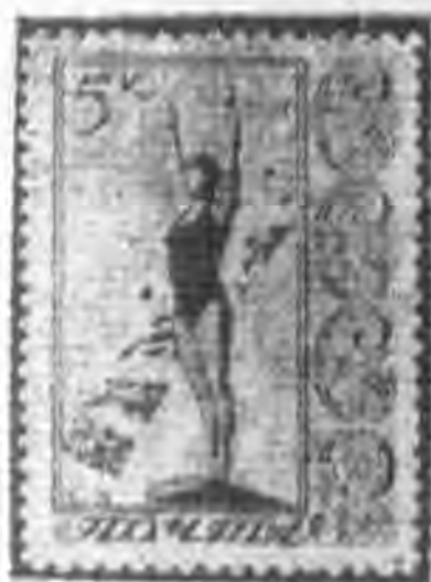
5K 深紅色 scarlet