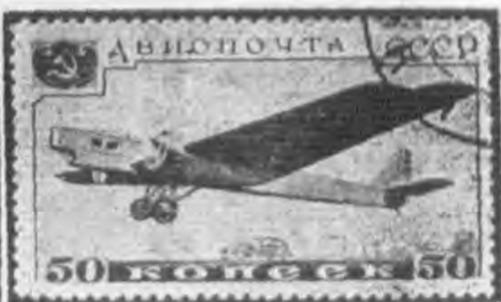
50K 暗紫色及黑色 dark violet & black