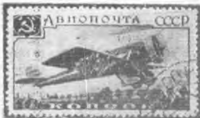
10K 黃棕色及黑色 yellow brown & black

1937 Aviation Jubilee Exhibition Issue, (7) Complete