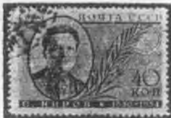
40K 黑棕色 black brown