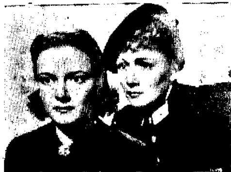
納粹間諜的自供中的女角

好萊塢影片之根據事實攝製的，我們見得多了，儘管影片所描寫的和事實內容絲毫無異，但劇中人物姓名慣常總是另名頂替，甚至於在影片端加一張字幕，諱謂該片係小說體裁，人物故事，悉出空想，偶有類同，亦係無意巧合，絕無假借影射之意，「一個納粹間諜的自供」則不然，它明白地承認它是去冬所破獲的納粹「納粹間諜案」的事實描寫，人物地點絕無掩飾，以如此公然坦白的態度，攝製敘述足以引起巨大事變的國際陰謀影片，不僅在好萊塢，即是在全世界也還是第 次，正是爲了這一點特徵「一個納粹間諜的自供」乃不能與任何影片相提並論，不能像一般影片那樣把它歸入那一類，但是由於製作的審慎，表現的完善，演技的優越，就把它當作一張普通的娛樂片，它也是一部閃爍着成功的光芒的作品，即使對於國際事件毫不注意的觀衆，他們也將從該片中得到一種新的啟發與興趣。