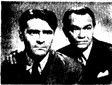
「納粹間諜的自供」中的男角

「一個納粹間諜的自供」便是根據那件案子而攝製的一部影片，劇本則以杜氏原稿改編，劇情甚少竄改，表現力求忠實，所以這部影片在事實有根據，顯露充份這兩點上是靠得住的。