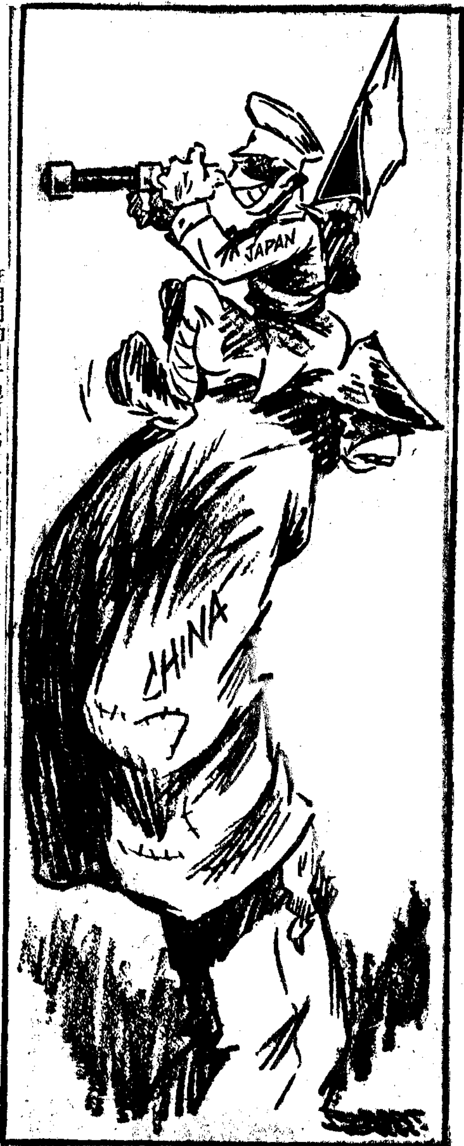
在明朗的日子他可以望見澳大利亞以及菲律賓(是中國之奮鬥乃為全世界而奮鬥)