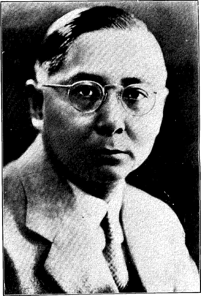
立 法 院 院 長 孫 科 肖 像