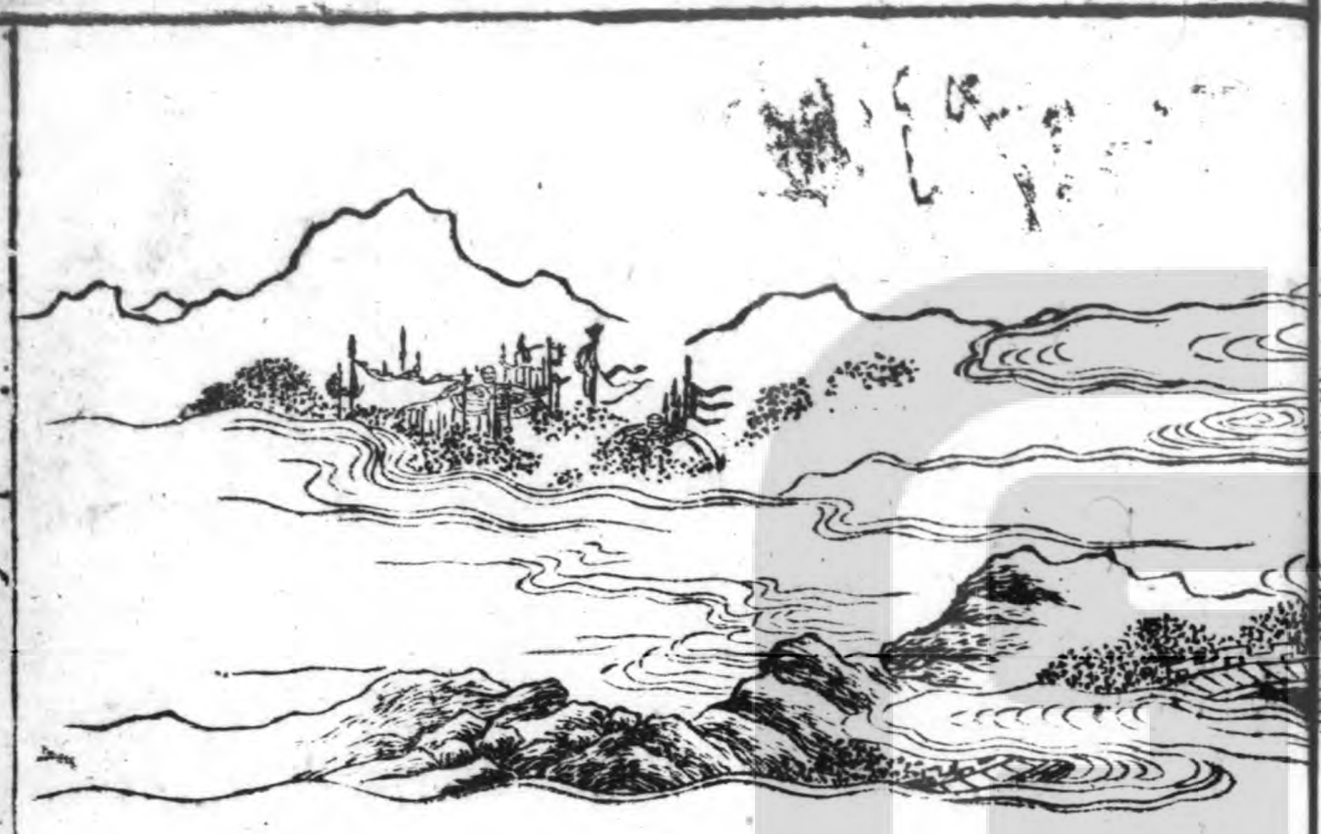
紅錦旗喧狂劫賊 國中插桂