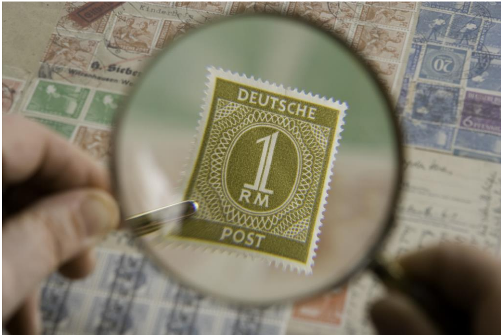
Magnifying glass2jpg