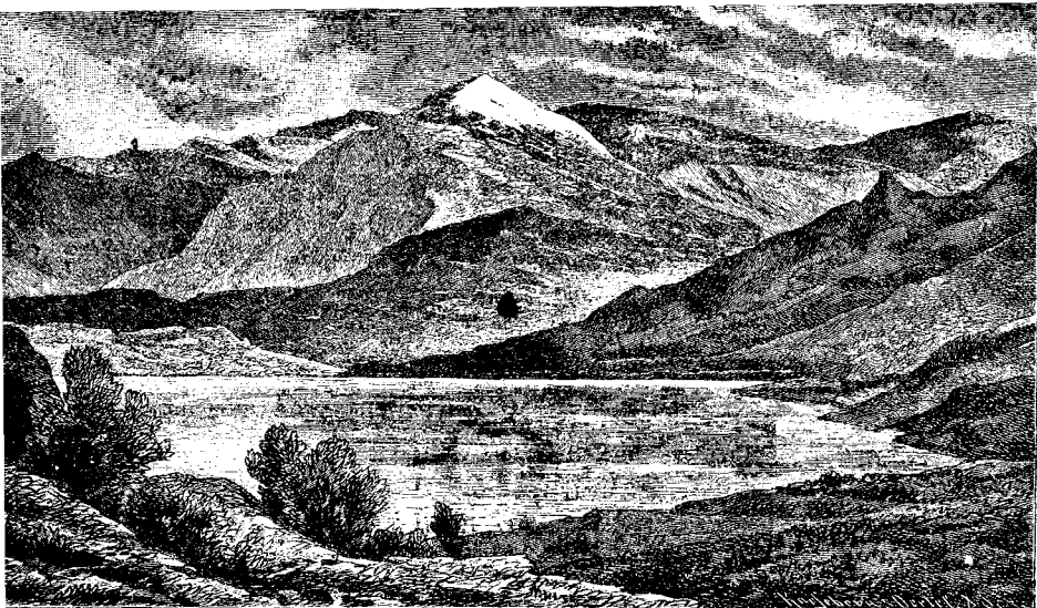
Рис. 22. Гора Олимпъ.