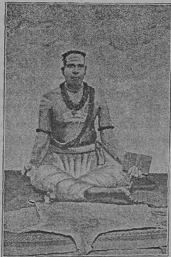
ஸ்ரீ காசிவாசி செந்திமாதையர்.