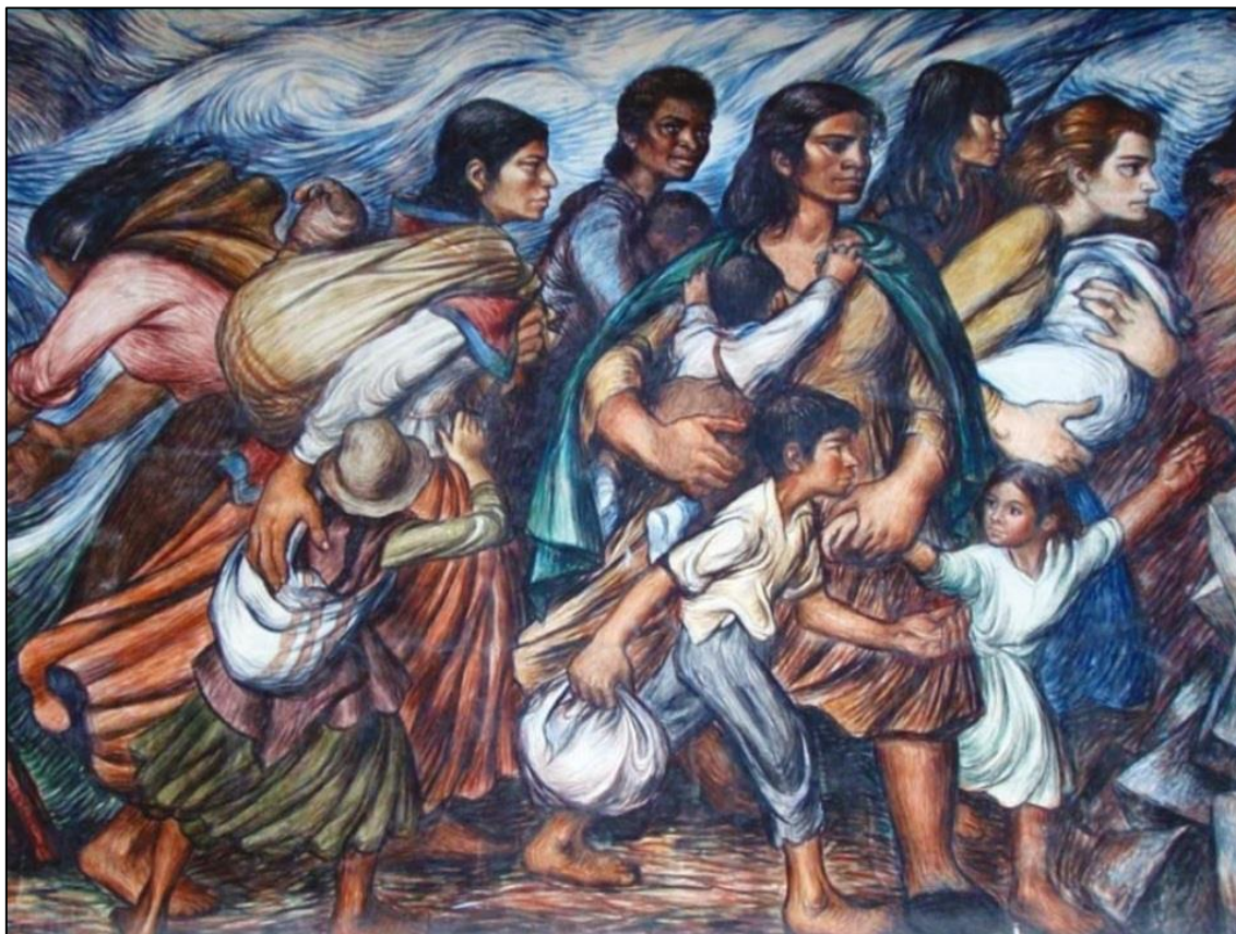
Ilustración 2: mural que representa la caravana de la muerte

Autor: Ing. Carlos Alberto Espinoza Arica