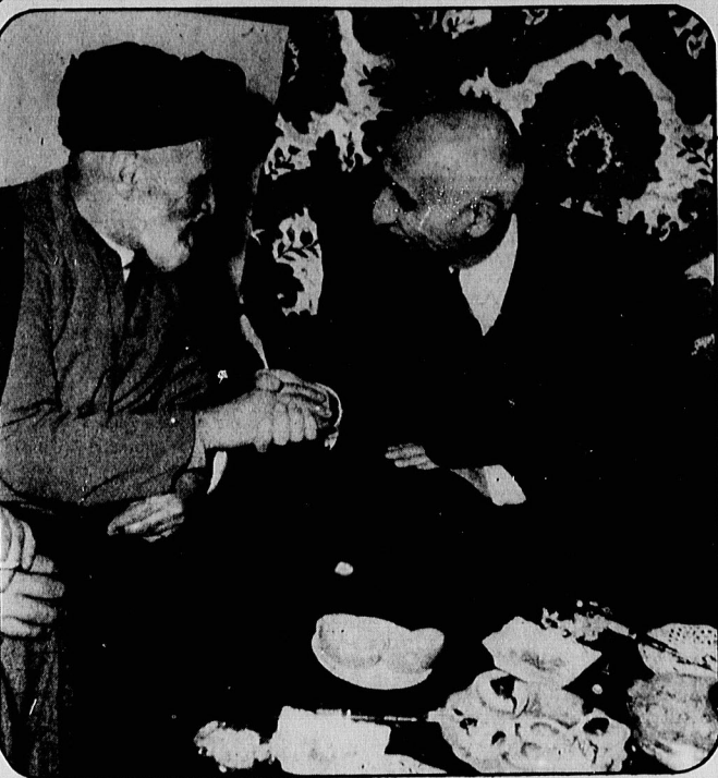
دکتر مصدق در منزل آیت الله کاشانی. این دو رهبر در سایه وحدت توانستند نهضت ملی شدن نفت را به پیروزی رسانند.

مهندس عزت الله سعیدی نماینده مجلس شورای اسلامی