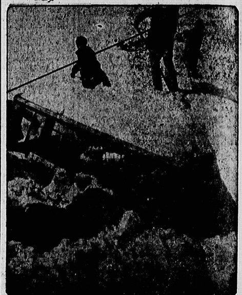
بعضی از اعضای اطلاعات از سقوط بهمین جانمها را در مکانی نامشور

نظر خواهی از سردیوران روزنامه های صبح و عصر در صفحه ۵ رئیس شهر بانی جمهوری اسلامی تغییر کرد در صفحه ۲