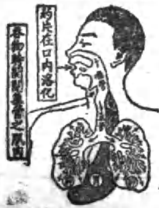
韋廉士吸入止咳片

韋廉士吸入止咳片是直接治療氣管與肺之特品統治咳嗽傷風哮喘喉痛氣管支炎以及其他腦喉等疾 各藥房均有出售每瓶一元或向上海江西路四五一號韋廉士醫生藥局購備每瓶一元二角郵費不取