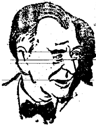
主張封鎖 日本的美 國參議員 外交委員 會主席畢 德門氏