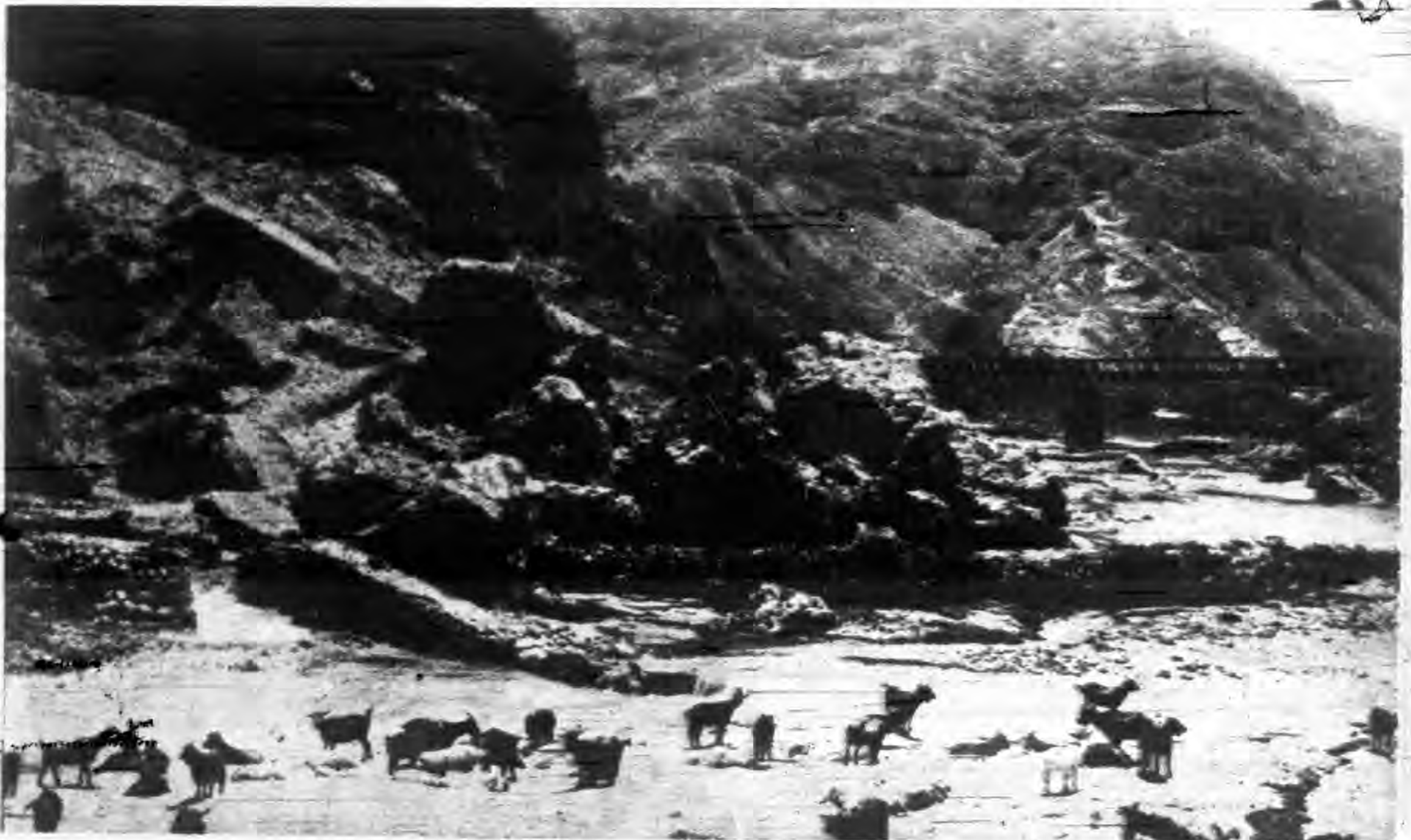
寒荻謝 關子娘之名著上史歷