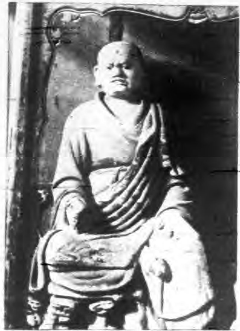
(右)趙城縣廣勝寺宋塑羅漢像