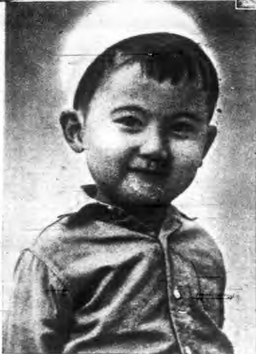
攝岡智李 林士子公長之君賢均王