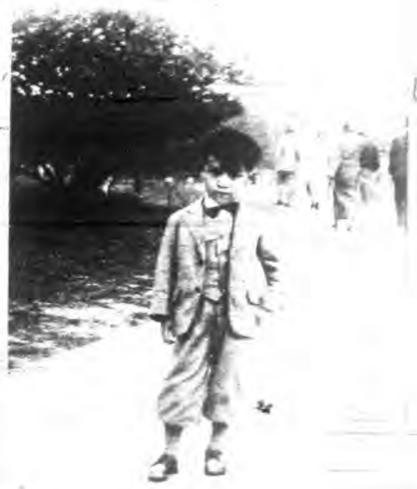
攝雲 滄雲子公大之君而堯宋