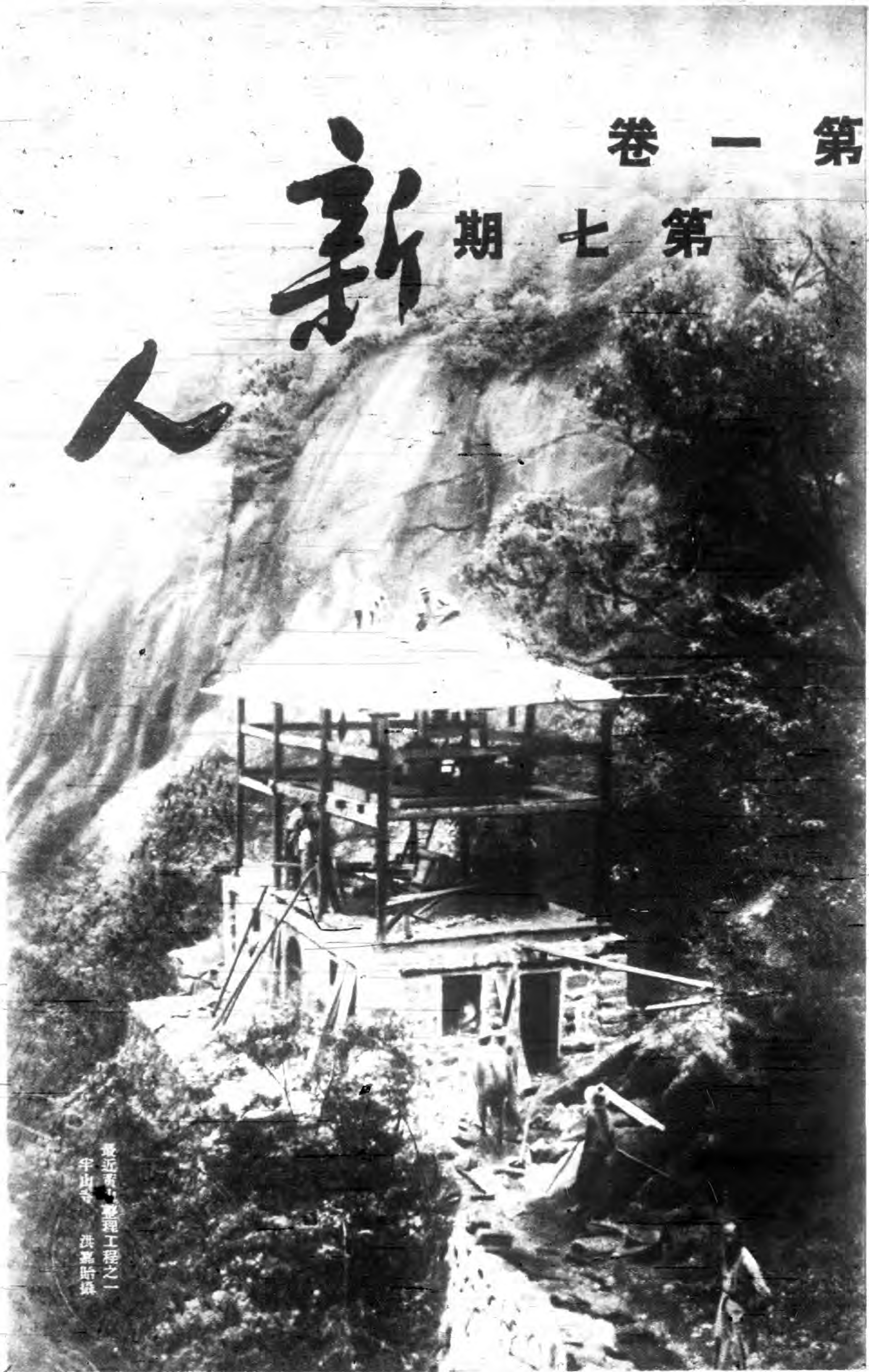
最近著名整理工程之一 半山寺