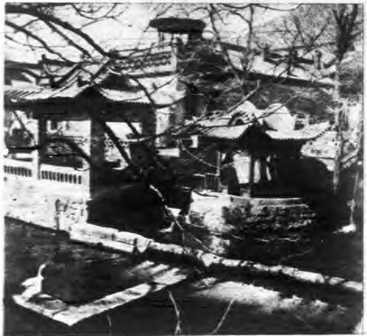
晉祠風景之一 上海國難宣傳團攝 太原晉祠遠景 上海國難宣傳團攝