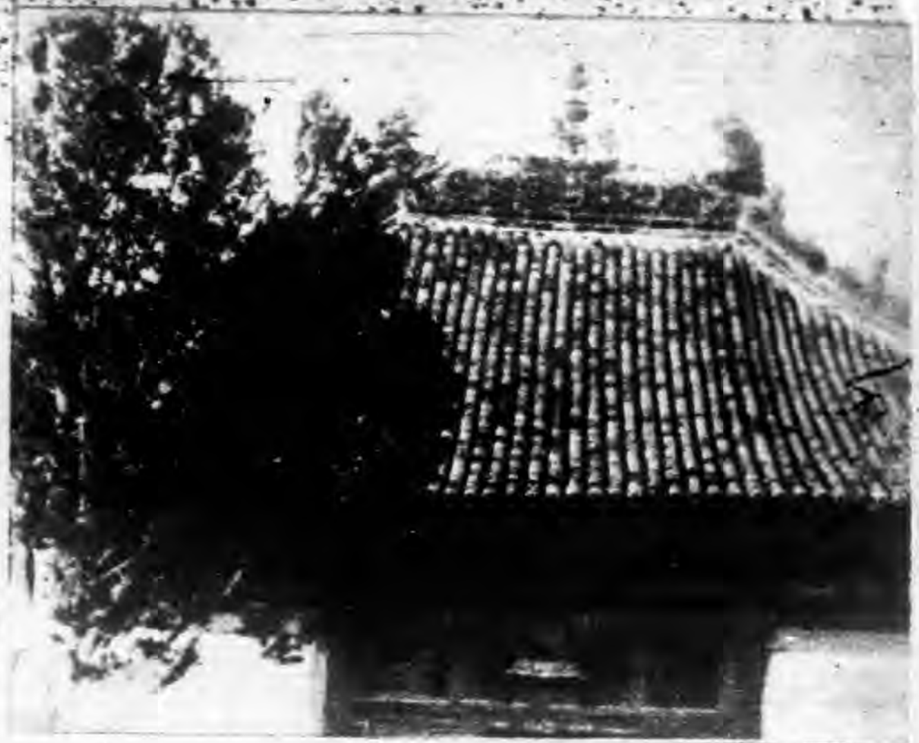
廣勝寺毗盧佛殿為五代時建築