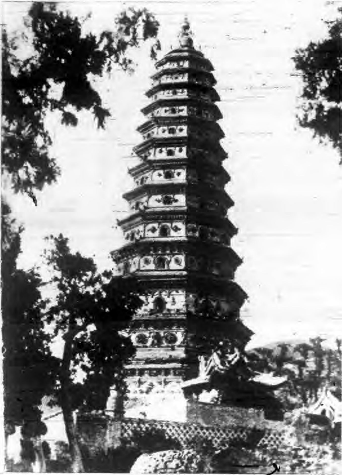
攝寒荻謝 塔利舍代唐寺勝廣縣城趙