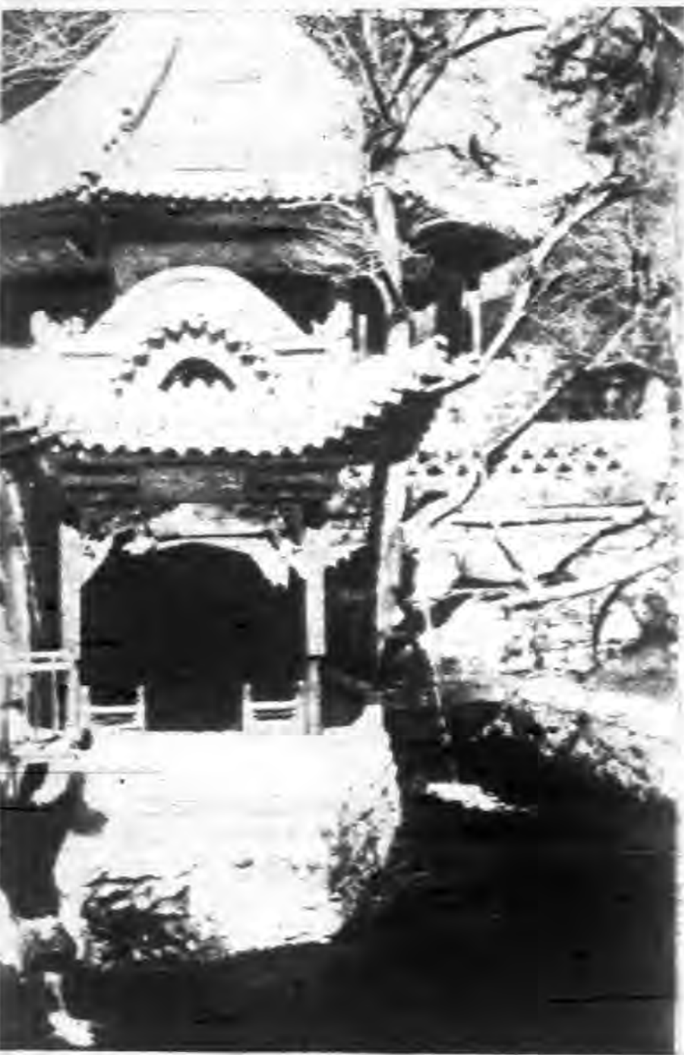
晉祠內堂母殿 上海國難宣傳團攝 晉祠風景之二 上海國難宣傳團攝