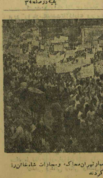
دردمونستراسیون پریروز عصر مردم ضد استعمار تهران معاکه و مجازات شاه خان را طلب می کردند

دیروز بازم فرماندار نظامی سرلشکر زاهدی را برای ادای تو ضیحات احضار کرد. درست بیست و شش روز پیش ازین زاهدی را از مجلس فرادادند و مامورین همین حکومت نظامی هم او را تادم در منزلش بدرقه کردند. زیرا بیم آن میرفت که مردم خودشان با او بروند و توطئه های لازم را بپوشانند. پیش از آنهم بیکبار همین نمایش ادای تو ضیحات ممانع شده بود آن روز زاهدی با «سر بلندی» خود را با مامورین معرفی کرد زیرا اطلاع بآن داشت تو ضیحات او مامورین را قانع می کند و بزودی رهایش می سازند. چند هفته گذشت و سر و کله زاهدی در مجلس پیدا شد. این بار آمده بود که «توضیحات» خود را با اطلاع میراشرافی و بقای و هم دست نشان برساند و در حالیکه مردم تشنگین پشت میله های مجلس نعره می کشیدند بآن خان فرصت دادند تا با اقلیت و کاشانی جلسه های محرمانه بقیه در صفحه ۳