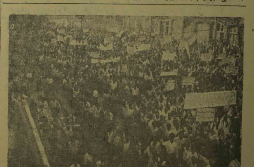
یک گوشه دیگر از دموستراسیون عظیم و پرشکوه پریروز

برای ملت ایران مسلم و محرز است که اگر امپریالیسم آمریکا حاضر است اداره عریض و طاری در کشورهای عقب افتاده ایجاد نماید و این کشورها را مشمول باصطلاح «کنک ترومن» سازد. منظوری جز دوام اسارت و عقب افتادگی این ممالک نخواهد داشت. امپریالیست های آمریکا مقاصد غارتگرانه خود را نمی توانند علنی تعقیب بکنند با ماسک عارف پینده با جرمی دارند برای امپریالیسم امریکائی تخصیص بیست مایون دلار کمک ترومن و سعی بیشتر زان در جهت توسعه شبکه جاسوسی و ابقاء عقب افتادگی ایران بسیار ناچیز است. زیرا