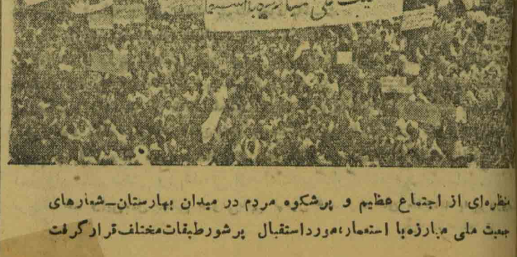
نظره ای از اجتماع عظیم و پرشکوه مردم در میدان بهارستان - شماره ای جهت ملی مبارزه با استعمار، مورد استقبال پرشور طبقات مختلف قرار گرفت

این غارتگران بین المللی با وجودیکه بر سر غارت ثروت ملت ما بر سر تقسیم حاصل بقیه در صفحه ۲