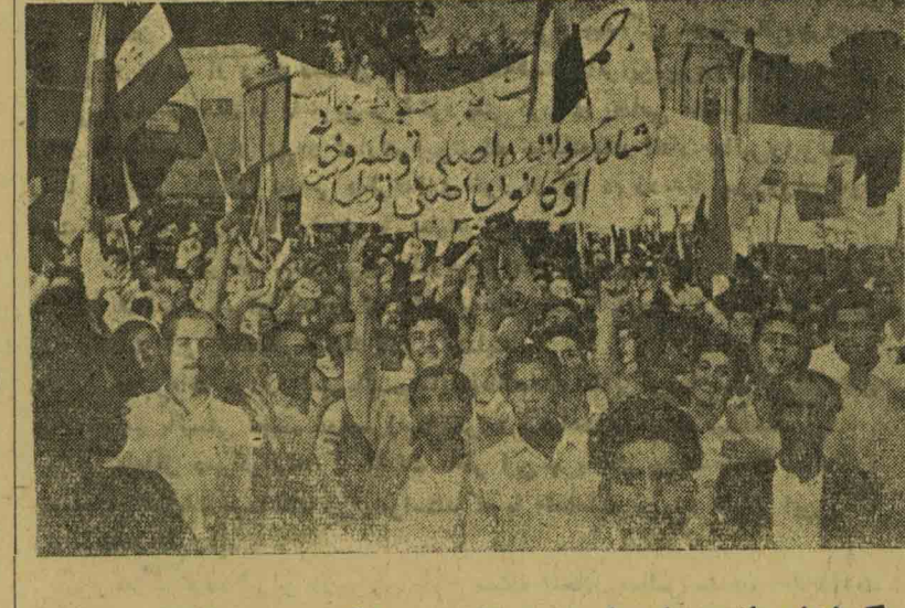
گوشه ای از دموونستراسیون عظیم و پرشکوه پریروز عصر مردم ضد استعمار تهران

احساسات شد سلطنت مردم شدیداً برانگیخته شده دیروز اکثر ادارات و بناهای دولتی تصاویر پسر رضاخان را پائین کشیده و پاره کرده اند و در همه جا همراه این کار تظاهرات شدیدی صورت گرفته است. از طرف دیگر مردم با ابزار و اسباب لازم بمیدانهای که مجسمه شاه در آن نصب بود ریخته و علیه رفم تهدیدات و حتی زنیان ای ایس و توقیف چند نفر در پارک شهر میدان بهارستان میدان ۲۲ اسفند و تویخانه و مقابل ایستگاه راه آهن مجسمه های منحوس شاه و رضاخان را سرنگون کرده اند. و بزرگترین عکس ساکو که تصویر شاه و کسان او در آنها بود پکلی خورد و منهدم شد. همچنین مردم به «خیاط دربار شاهنشاهی» نزدیک مخبرالدوله حمله کردند. بقیه در صفحه ۴