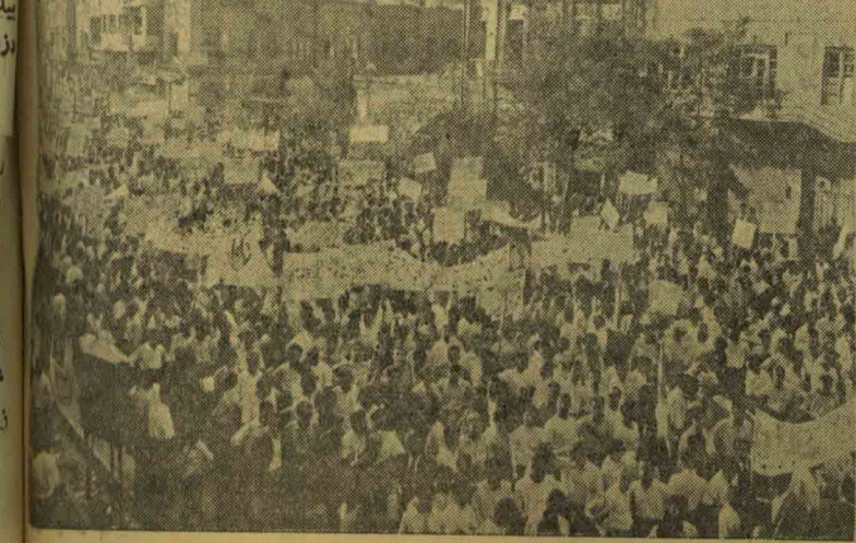
گوشه ای از دموستراسیون در خیابان سرچشمه

گروه های خائنی که مسئول گارد پاسبان های وزارت دارائی می باشد و جریان چیره خواران باند کودتاچیان است، برای ارباب فراری خود تیبلی یقه چاک زدند و اماشم و غضب کارمندان او را بجای خود نشانید.