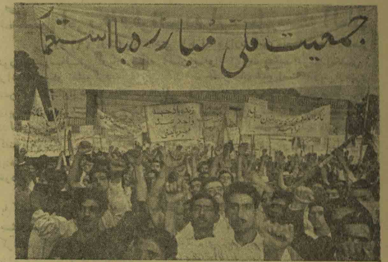
یک قسمت دیگر از دموستراسیون عظیم و پرشکوه پریروز عصر