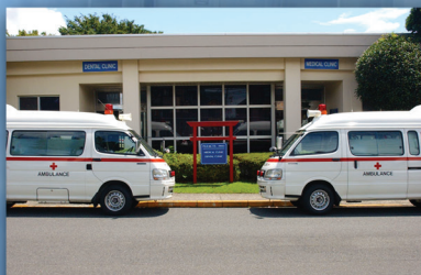
BHA Yokohama (Negishi)