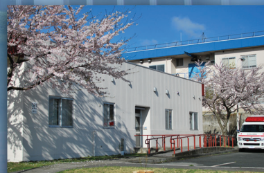
BHA Camp Fuji