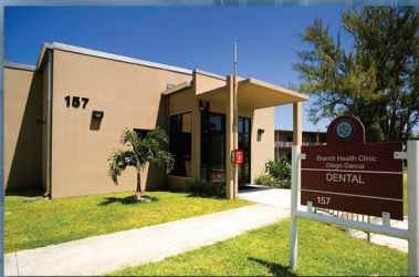
BHC Diego Garcia