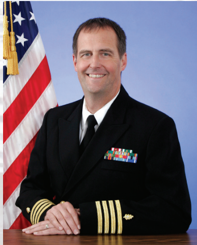
CAPTAIN MARK D. TURNER MEDICAL CORPS UNITED STATES NAVY