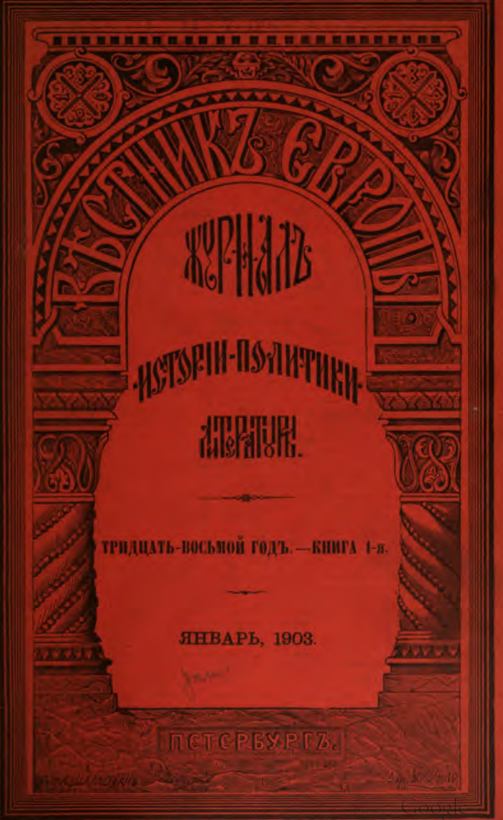
Тиниграфія М. М. Стасилавича, Вас. Остр., 5 л., 28.