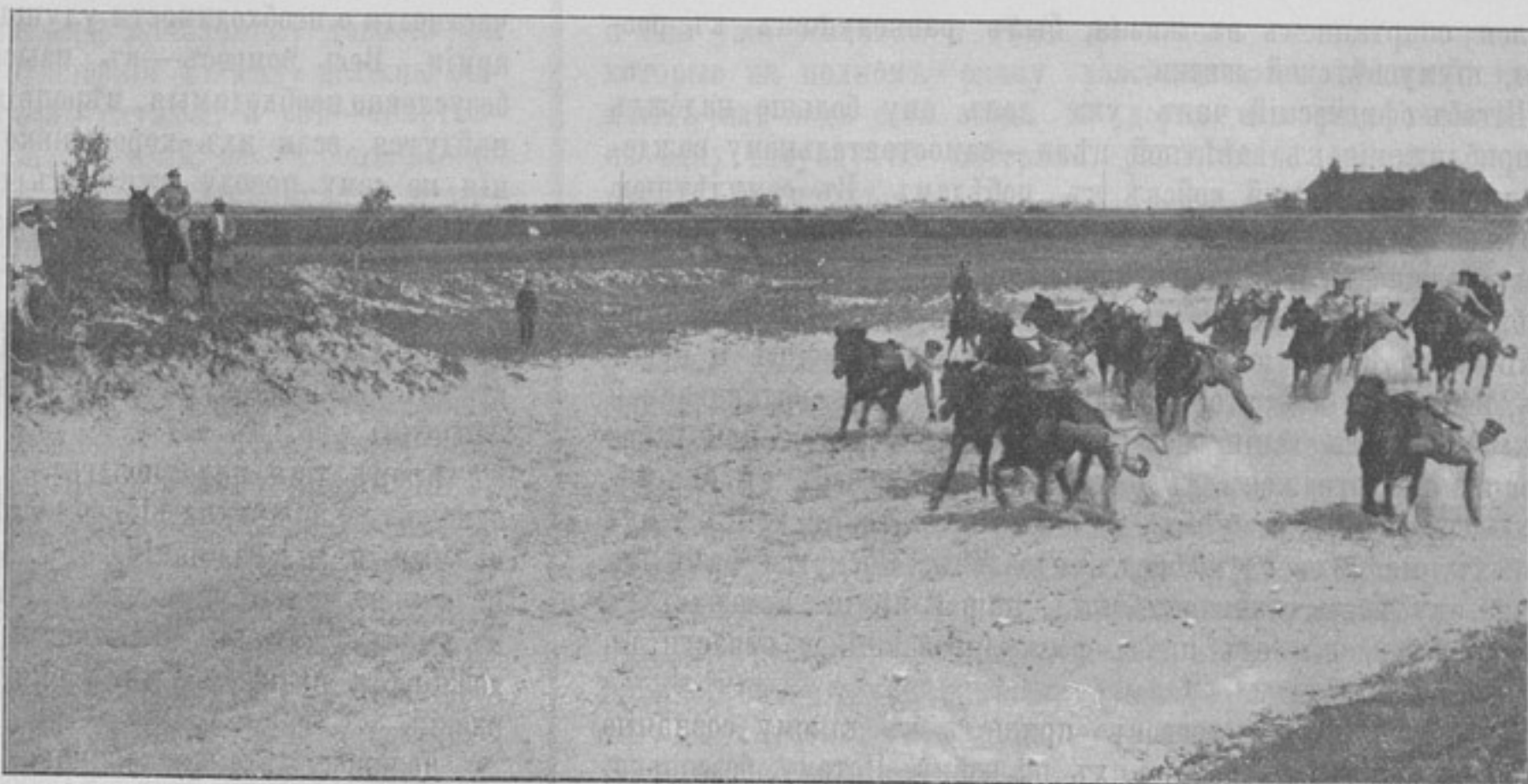
Доставаніе съ земли рублей джигитовщиками 13-й конной батареи. (Къ статьѣ «Джигитовка въ 13-й конной батарее»).

Стремленіе же къ идеалу, взятому Суворовымъ, ставитъ