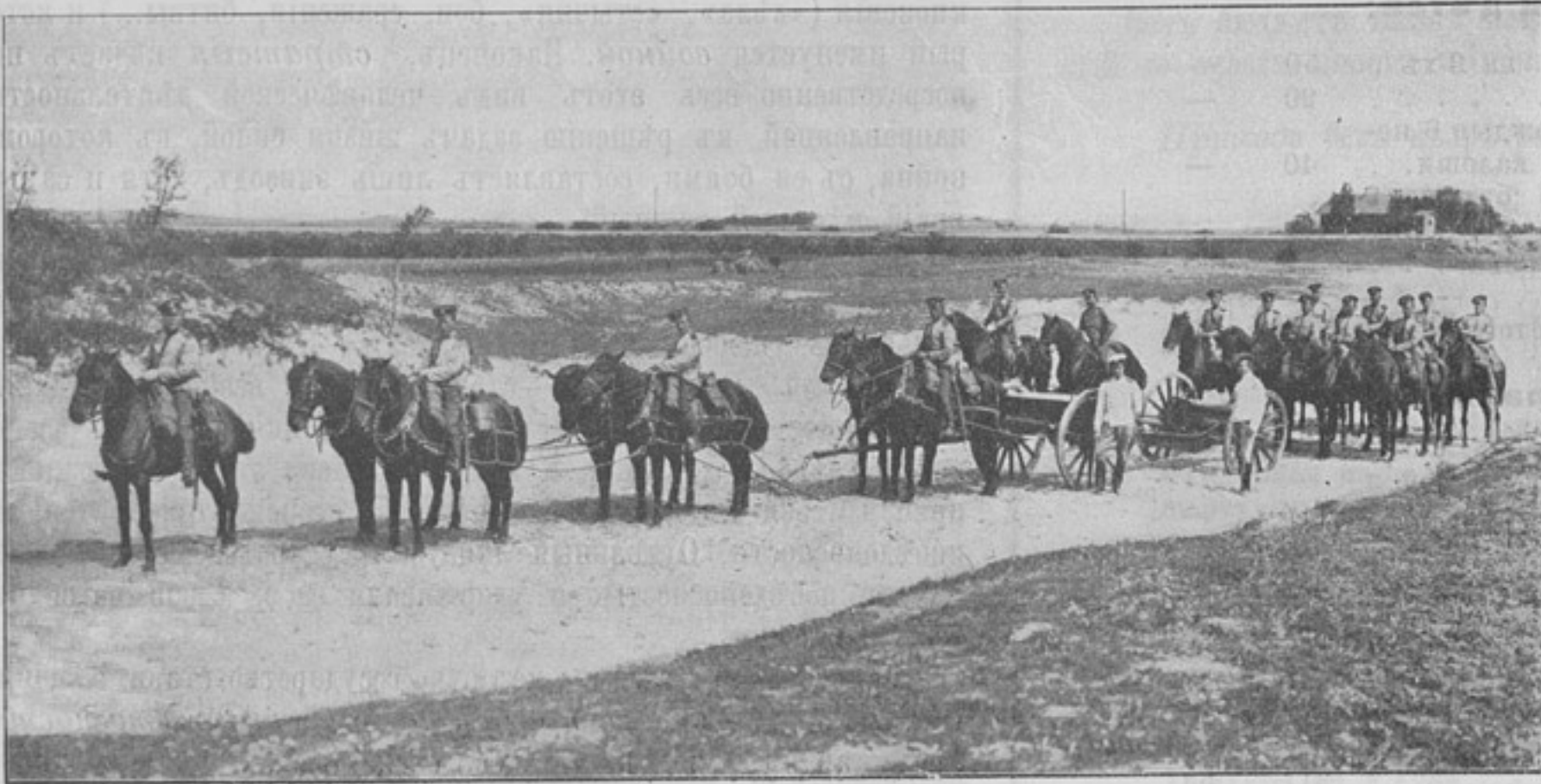
Орудіе 13-й конной батареи взявшее призъ за стрѣльбу въ 1907 году. (Къ статьѣ «Джигитовка въ 13-й конной батарее»).

ихъ недочетовъ, подобно положенію французовъ въ Италіи къ пріѣзду туда главнокомандующимъ генерала Бонапарта.