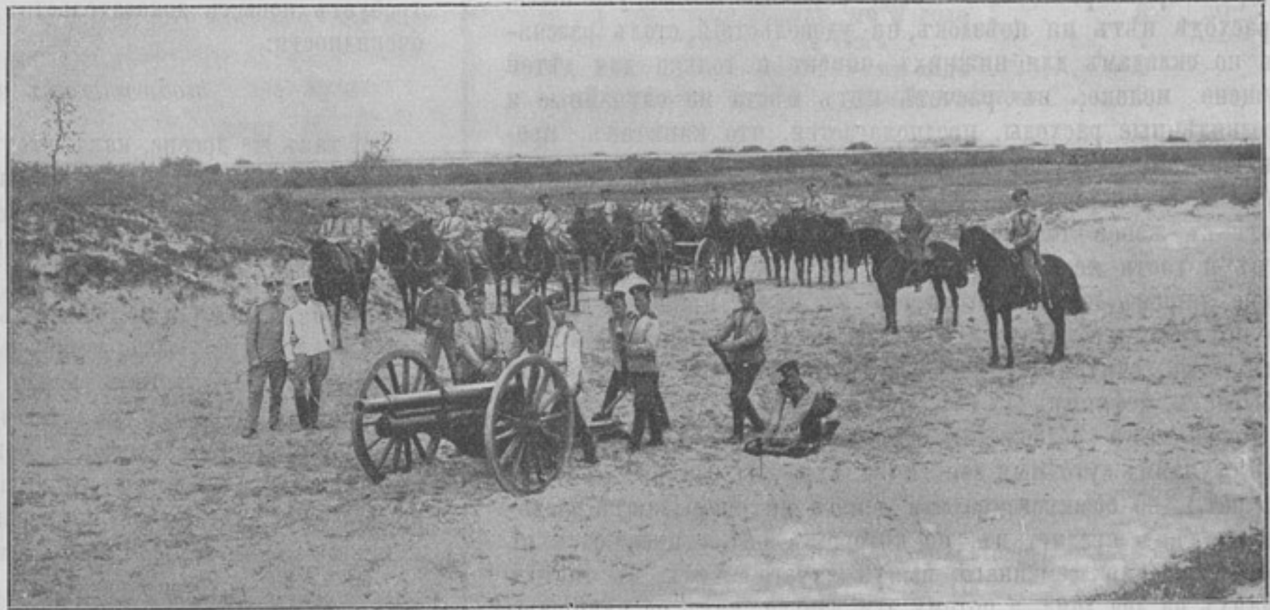
Орудіе 13-й конной батареи въ порядкѣ для боя съ офицерами батареи. (Къ статьѣ «Джигитовка въ 13-й конной батарее»).

Не вспоминается ли вамъ изъ исторіи нашей такой образецъ, гдѣ стремленіе на вершину военной славы, къ полководческому рулю имперіи преобразило въ истинномъ (боевомъ) духѣ всѣ должности, всѣ ступени военной іерархіи, по которымъ восходилъ человекъ, понявшій, что единственнымъ нашимъ идеаломъ можетъ быть—искусный предводитель, умѣлый полководецъ.