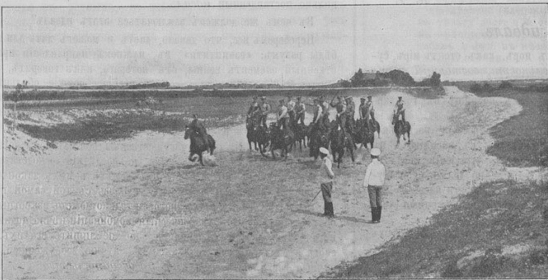
Взводъ 13-й конной батареи на полномъ ходу, стоя на лошадяхъ. (Къ статьѣ «Джигитовка въ 13-й конной батарее»).

Что сдѣлало Суворова истымъ военнымъ человекомъ, въ то время, какъ для этого изобрѣтенъ былъ универсальнѣйшій способъ—записывать дѣтей въ гвардейскіе полки при самомъ рожденіи, при чемъ Суворова не записали, какъ не вышедшаго видомъ для грубаго военного идеала—онъ былъ миниатюрень, сухощавъ и слабъ сложеніемъ. Въ десять лѣтъ, увлекшись сочиненіями Плутарха и Корнелія Непота, Суворовъ облюбовалъ себѣ идеаломъ