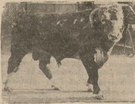
Hükûmete hediye edilen boğa