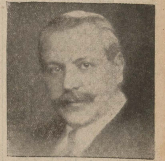
Beşnelmil Avrupa güzellik müsabakala - rının mürettebi olan ve Türkiye Kralice - lerine karşı dalma müstesna bir nezaket ve samimiyet gösteren

Bu sene, biraz geç kalmış olduğum - uz için müsabakamızın şeklinde bazı tebeddülât yapmak mecburiye - tinde kalıyoruz. Esasen, üç sene dir, yaptığımız müsabakalardan edindi - ğimiz tecrübeler de bize müsabaka şeklinin biraz değişmesi lüzumunu göstermiştir.