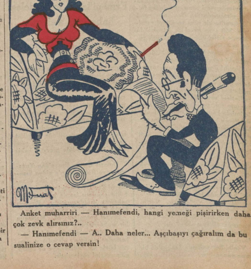
Anket muharriri — Hanımefendi, hangi ye - neği pişirirken daha çok zevk alırsınız?..