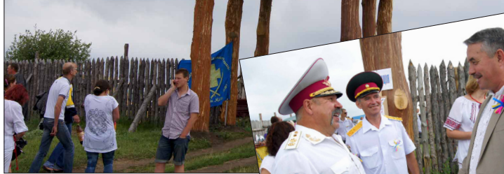
Нова сторожова вежа над входом на місце святкування.

Таку кількість козацьких оселедців, хвацьких вусів, яскравих шароварів, пістолів та шабель, як минулої суботи, Шар-гора бачить раз на рік — коли сюди на своє традиційне свято «Козацької слави цілюще джерело», зіїжджаються козаки та гості з усієї Полтавщини.