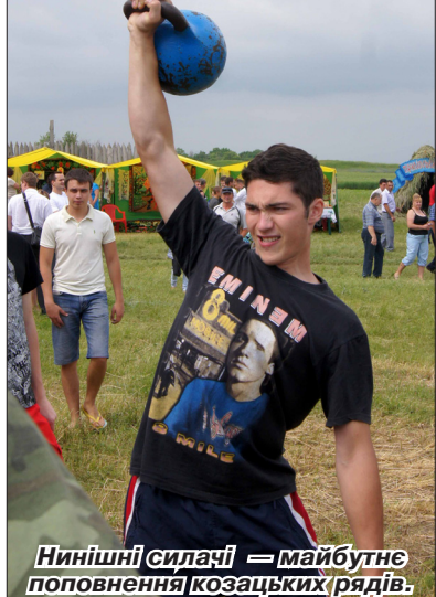
Нинішні силачі – майбутнє поповнення козацьких рядів.