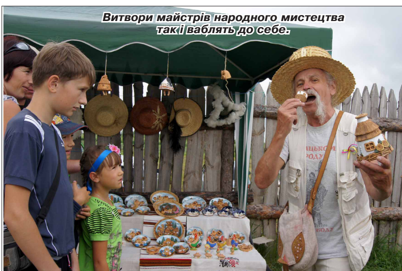
Витвори майстрів народного мистецтва такі ваблять до себе.