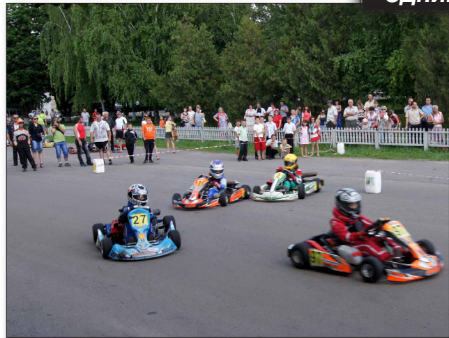
Із 24 до 26 травня другий рік поспіль у селі Говтві байкери з усієї України збиралися на байк-зліт «Останній форпост-2013». У перший день заїзду мотоциклісти відвідали і Козельщину, де після показових виступів юних картингістів урочисто проїхалися колоною навколо центрального парку.