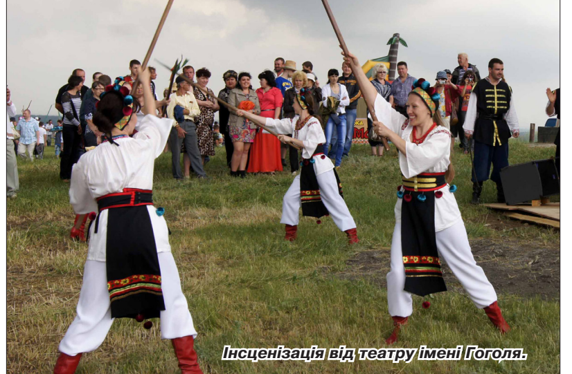
Інсценізація від театру імені Гоголя.