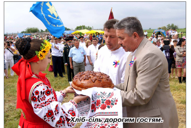
Хліб-сіль дорогим гостям.