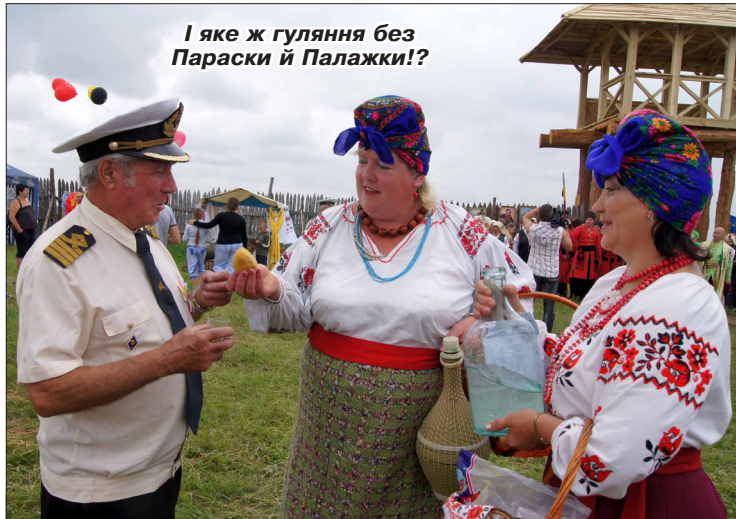
І яке ж гуляння без Параски й Палажки!?