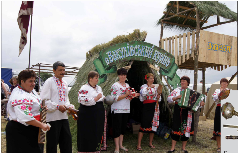
Глядачів на коцерт зібралося чимало. Шкода, що не вдалося побачити усе заплановане.