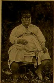
[تاریخیه] ابدركلی حقیق

اساده موجود اولان دماغی حجره رك شده بحرك و تیج و یاخود بدرجه شدید اولدق مادیار كیفیت اوزره باعظا ابدلكاری زمان بر كیفیت مخصوصه تشریحیه اوره و افعال مادییه دائر بر شی عیاضله ابدركل بولك تأثیریه، منزل و متأثر اولدیننه نظر آفراندی اجتماعیك كندیسی تشکیل ابدن افراد اوزره و وظائف الاعضائه متعلق تأثیریه بر مفا بولونور و (ایپنوتیزم) ابدلر حات نومه كیتر كاری كیمه لرك عرض ایتمكاری