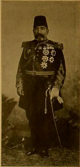
[اطرفان: عباد برادور] [اوتوكشي: وياهد اشكردور دارالصناعه سي] اناطولي ولايات شاهانه سنك تفتيشته مأمور دولتو احمد شاكرا پاشا حضرته نري حضرة دولتو احمد شاكرا پاشا الامور لفتيشن الولايات الشاهانية الروامة في الاناطول

LE MARÉCHAL CHAKIR PACHA Inspecteur général des Vilayets de l'Asie Mineure