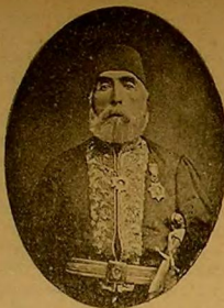
مرحوم حاجی حسین پاشا

سعادہ (طامشی) نامندہ بر سبزہ چی اقدی؛ اولدی رزی قورلیختہ تمین ایدلمشدر. — اشتراب رزی قورلیختہ تمین ایدلمشدر. پاشندہ مائی زدن بر صادق و صاویرلیک وجودیہ پیش ایک کیو (الی اتی قیہ متیقہ) نفاقتہ اولدی بولون تمین ایدلمشدر. بوکا کندیلرچہ (ناموس) اسفی ویردر. آرقستندہ پشہ زدن بر تمین و اوژورینہ داغاندش قیون در یستدن معمول پرکورد کیمش و اتنتہ لیکر مائی بر پشال باغلا. مشدر. ایقارندہ (مداس) تمین اولتان و اکریا جہاز ایلیمتک ایلیمتک اولوسی ایشیق بر نوع غنی وارددہ بلندہ کوریلان (د) شکندہ ک شنیج برن اہالیستک عمومیہ قولاندقاری (جلیبہ) در.