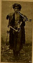
اعظمی، جن الہی الندی مرادان

مشدر. بو جوجی ایومدی پاشندہ بولدیئی حالہ یکری پاشندہ بر فرمان مستندہ کورمکہدہ طما، تالیس، صاحبہ خسروارندہ ساژ بیوک آندلر سر مستندہ کورلینک کی ہوسات طفلانہ کلیا بری بولمقدہدر. طما؛ اختلافدن جناب، مزبور، تالی افکارہ نمایل خواروق خلقتدن مایہدہ برظن کالہدر. ایستہ جوجک اوصاف خلیقہ وطنیسیمہ ختندہ دریمان اولتان احوال خواروق اشغال افضالیہ ستجافتہ تالی اعلی قضای اہالیستدن محمد داغ اشع اقدیلرک نظر دقت و استغرافی جاب ایش اش موسیلہ اولا تقوی قیدتہ مراجعت و تحقیقات مقننہ اشع ایدرک صورت خصوصہدہ الیرمش اولدیئی فلترخرافی مطلعہ منہ کتوموش و پروریہ معرہ پردہ معلوات و برمشدر.