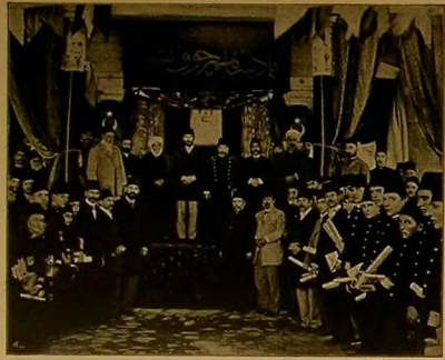
المغزانی : خاربه سی مسئول (توقیف و یانه اکرده اوالصنامه سی) توزیع الماوی فی مکتب امدادی (روسه) Une distribution de prix a Brouse

طولر تانر آب و اقدار ستر قالدینن حین ایلیان برکی دها اوجر سورده مسلح فقط فا طرفزده متحرک غیر مقدر برحاله کتور مهموزی واسطه سله جوسوراه برضربه اجراسیله صولک حینی تجریه ایدیولور . (۵) سفاکشک سرتی - یعنی سدهنده بولندینمز عاقلده سفن حربیه سرت سیر لریک قوتن عاقلده برآده و اعیانه مالک اولدین نظر ایشدر .