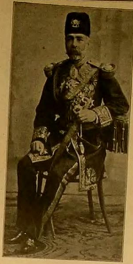
انگلیزی اربابان عالم آفرین شاهزاده نایب ولیعهد پادشاه ایران...