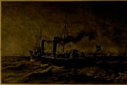
[رسام: میرمان اسماعیل حق] دوتخای هاپون مهبات مقربوندن ایزی افتشان طوریندو ستمیوبلی اللولبلر (المراة) لسانه رقی امتان) Le porteur ottoman « Bek-Efikhan »

واپور، آهسته آهسته طرایبیمه یاقلا شیوردی . بن اوکلک، اطلولی ساحله، اویشیل داغرده اوپان فیض جاریه باقیو- ردم . هپات .. اوپاش بولوط بنه اوکلدن اوچدی . شمدی باقمعه مقدر اولامادم . دقت ایدیم، هم یوربوردیم، هم کریکلیرینک اور جیه بی سوزبوردی . بر یوک درهه چیقه چقدیم . بریاش رفکر، جمهل رحس ایله بیتابه قالدیم . اوکا باقیورق، اسکله قوشان غلبه لک اتنا ایلدوک طرایبیمه چیقه . بیون ؟ یونی بن ده بیایمبوردیم . ریختمی آلمی بوغازدن قوبوبسکن سرین روزگاره طوبور، آتینن، درین، ناپیش برین دوشونیبوردم، آسزین بن، نقرمه