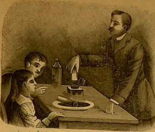
چوچتر رنگاندی عطف کناه دقت ایچورل تعریف اولاندی...