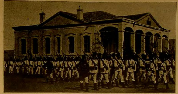
[مطابق: روزنامه چنگ] تزیینات عسکریه خلافتناهدین دردیجی اردوی هاپون پیاده عساکر بساک نهادی العساکر المشاة من العسکر الرابع الامونى Battalion d'Infanterie (4 e Corps d'Erzeroum)