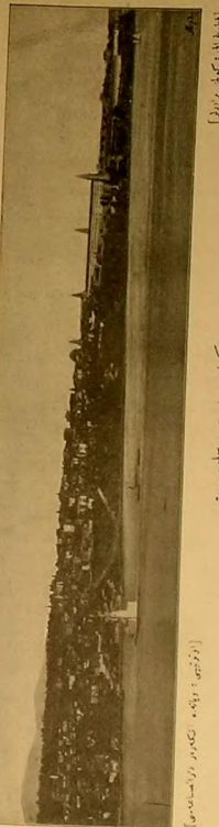
[تاریخیه] ابدركلی حقیق

مع مابقه لومبروسو مشابهت اجداد حقیقده وضع ابتدیی اساسی قسماً ترك ابدركل جرم خلیقك علم الامراضه تابع بر ادم یاخو بر جنون خانی ابدركلی الزامیوست خلیقه اصل مرضك علامه مادیسی كورئیمان صرعه عانی اشكاله قریب اولقه جرم خلیقك صرعه قریب مبتلا كیسسه ابدركلی قطعاً ادنا ابتدی صرعه ادر اكرده خلیقاره جرم خلیقاری بر عینی قابلیتی طبیعه جم وتوحد ابتدییكی وصرعك نوبت احتیاجیه كی باش دومینی سی مرسله كی اشكال غریبیه میانی مسلك ابدلر وانما ایضاً امرده بو مسانی متناسز بوله یازرسده مرضك یلكر الزامده ظاهر اولان علامته حصر نظریه جرمه مرضك تاریخ طبیعیی شكل ابدن كافه احوالی مطالعه ابدركلی حالد عدم مناسبت اصلاح كوله چكئی در میان ابدی . تشریحیه، منافع الاعضائه مالمفده اولدایی وجهه جرم خلیقاره اید صرعه لیریشی واحده در مدافعه قفقه متعلق اطراف مغز، وجهك موازنسركلی، باش اورت ككندیه قور بولوق جهه غلظت نسله، قات سرعی احساس كی احوالی و كیفیات خصوصیه جرم قفلار اید ابدركلی سی صرعه مرضارنده دخی بلاهت عقلیه كی فرق عظیم ذوقنق نوبت حسیات عارضاتی جاسزلق نحو و احاطه رغبت غلط وقاعدیه محتلف وجود كورده اولان غرور فوق ماده بولونور، لومبروسو مطالعه سنده اخیال ورم یابدیكی اعتراضه در پیش سنده صرعیه متعلق غضب وتور مرض كی در حال ظهور ایدر بولوق اولان مدت دوامنده مرضك استفاده انك ابتدییكی مقصدی