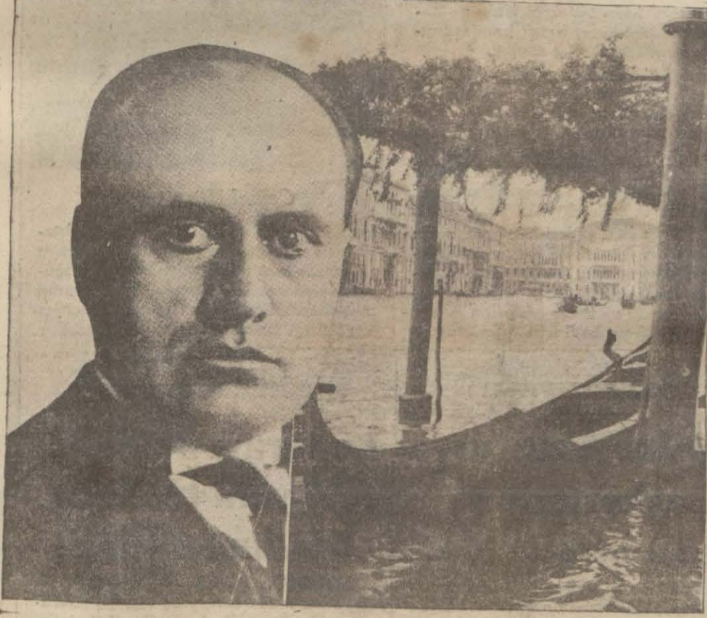
Mösyö Mussolini ve Venedikten bir manzara

M. Mussolini gelir gelmez perşembe ve cuma günlerinin-programını tetkik etmiştir. M. Suvich Venediğe giderek otele inmiştir. Bugün M. Aloisi ile Almanyanın Roma sefiri M. Hassel de Venediğe geleceklerdir. Diğer taraftan Berlinde İtalyanın Almanya sefiri M. Cerutti Venediğe gelmiştir. Lido istasyonunda M.Hitler ile yanındaki zevatı getirecek olan tayyarelerin inmesi için bir meydan yapılmıştır. Bir takip filosu meydana dizilmiştir. Bu filo hudutta uçarak M. Hitlerin tayyaresine Venediğe kadar re-