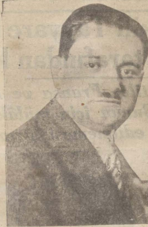
Cemal Hüsnü Bey

Bugün teminat ve kontrol komisyonu toplanmıştır. Muntakavi emniyet misaklarını komisyonu ayın 18 inde birinci içtimaya yapacaktır. Bu meseleler Cenevrede tetkik ve ihzar edilirken Alman-Fransız itilâfının halli için devletler a-