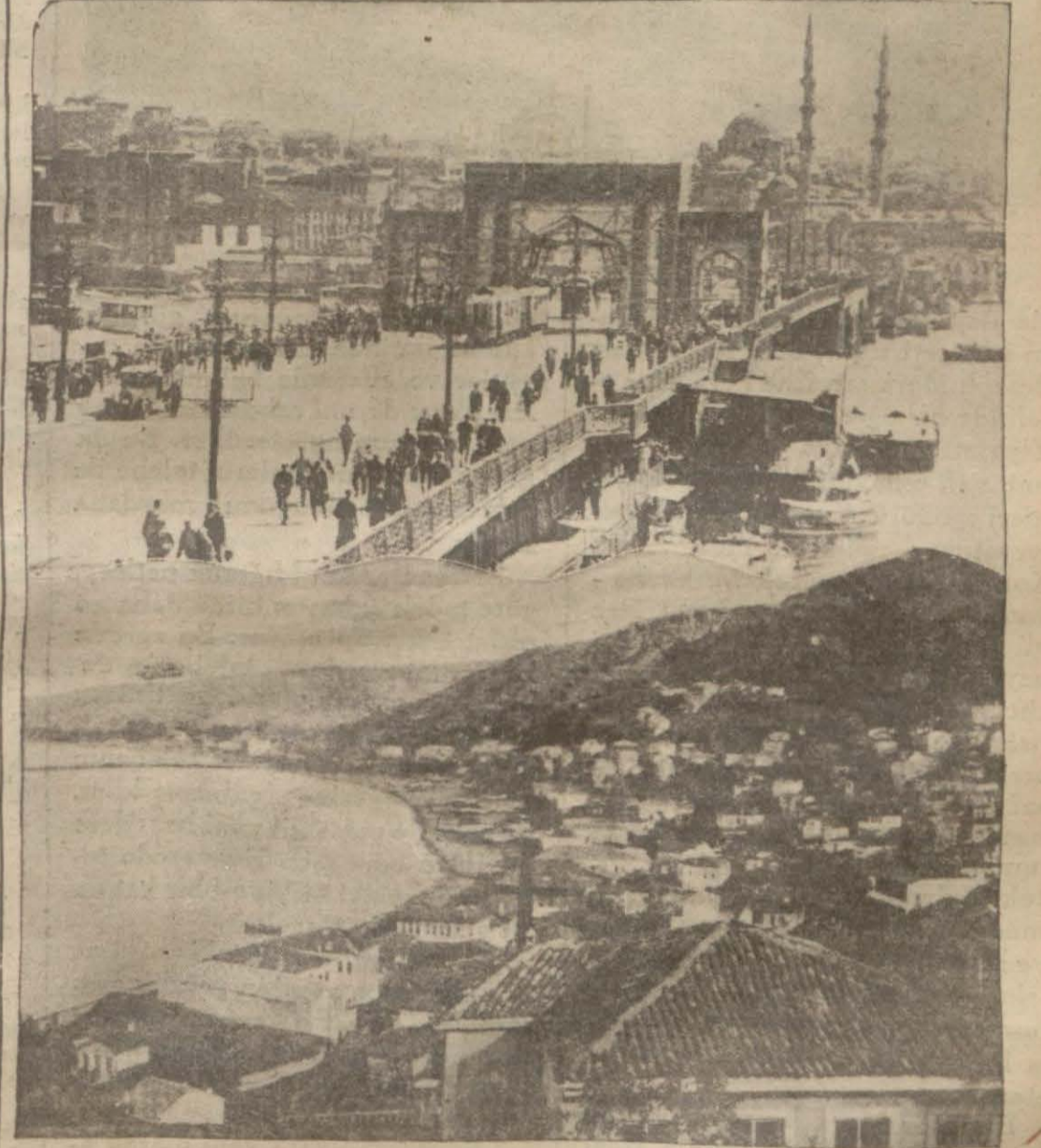
Köprüde yapılan tak ve Şehinşah Hazretlerinin dün vasıl oldukları Trabzondan bir manzara

Şehinşah Hz. Yavuz'a binerken büyük merasim yapıldı. Samsunda hazırlıklar. Şehir donandı