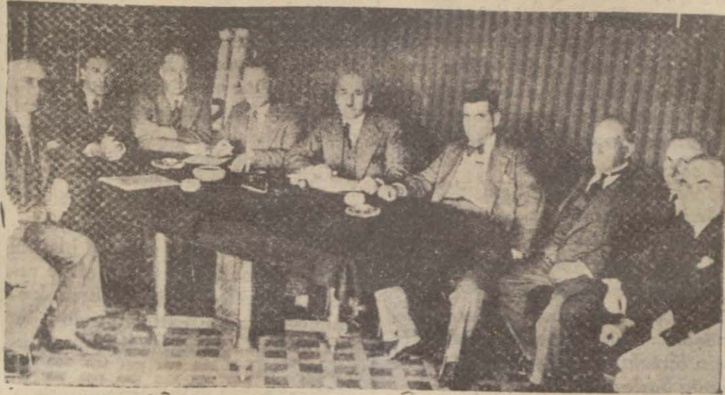
Demir sanayicilerinin dünkü içtimaları...

Millî Sanayi Birliğinde dün demir sanayicileri bir içtima yapmışlardır. Bu içtimada evvelâ memlekette demir sanayinin günden güne inkişafının Türk sanayii için mesut bir hâdise olduğu mevzuu bahsedildikten sonra, muamele vergisinden dolayı yapılması lâzımgelen cetvelin tanzimi üzerinde meşgul olunmuştur. Demir sanayicileri, bu defaki yerli mallar sergisinin demir sanayinin daha geniş mişkaya ve vüsat ile mütenasip bir şekilde temsiline karar vermişlerdir.