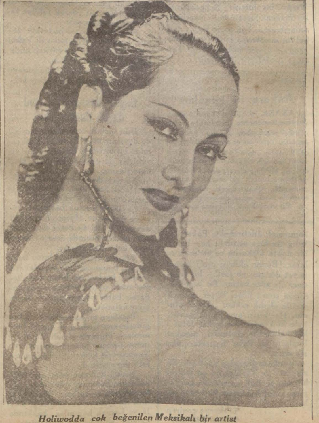
Holiwodda çok beğenilen Meksikalı bir artist

İşte Lupe Velez! Eğer erkekler sarışınları tercih eder sözü doğru olsaydı bu kadının yüzüne kimse bakmaz, herkes "kara Fatma" diye alay ederdi. Fakat Lupe Velez bugün o kara çehresi koyu siyah saçları, koyu siyah gözlerle bütün Hollywood'u yakmaktadır. Bu sinema şehrinde şimdiye kadar buna gönül kaptırmamış erkek yok gibidir. Gary Cooper'i bile çuldrıtacak derecede kendisine âşik etmemiş miydi?