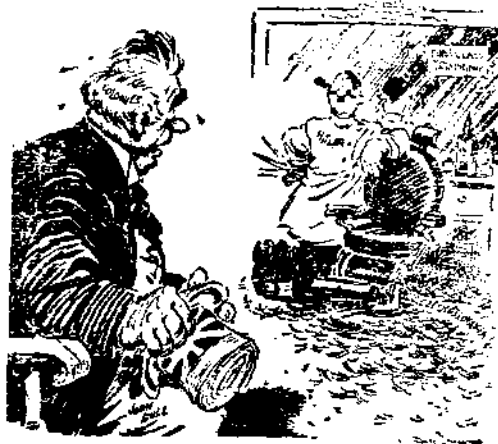
Shoemaker in the Manchester Union.

復於四月二十七日另提一立法案，主張授權總統限制美國對破壞九國公約之國家與美國之商業貿易。此項新法案，乃為彌補上次修正中立法案中「付現自運」條文之不足，同時該提案內規定總統為實施此項法案計，得於該項法案送交國會，發一宣言，在十日之後，即可發生效力。據畢德門於二十八日對美聯社記者云：此案通過，為政府應付日本對於在華美僑實施限制行為之必要，日本對九國公約，曾提供尊重之神聖諾言，惟自日本侵佔中國以來，不僅危害美國人民之生命，且更不顧