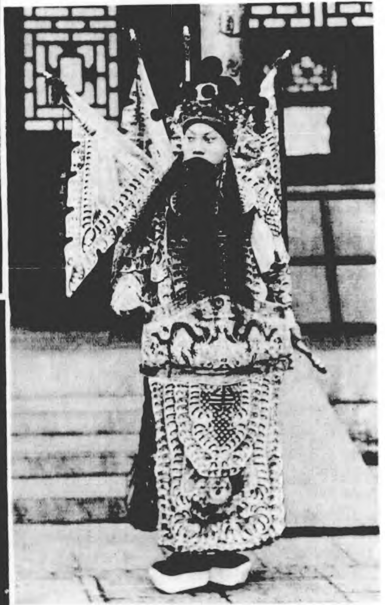
(飛岳) 岩叔余 州 壇 鎮