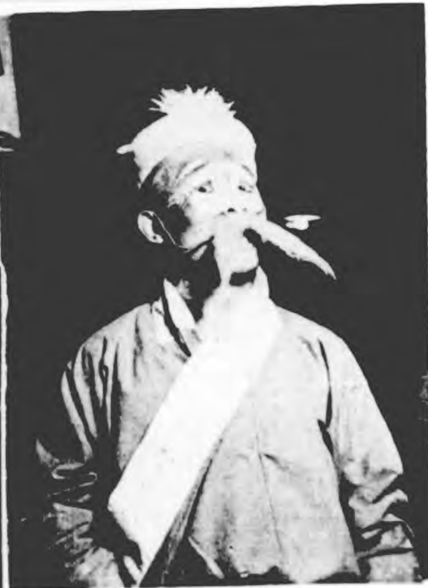
葉盛章 (李虎) 雙合印 ↑