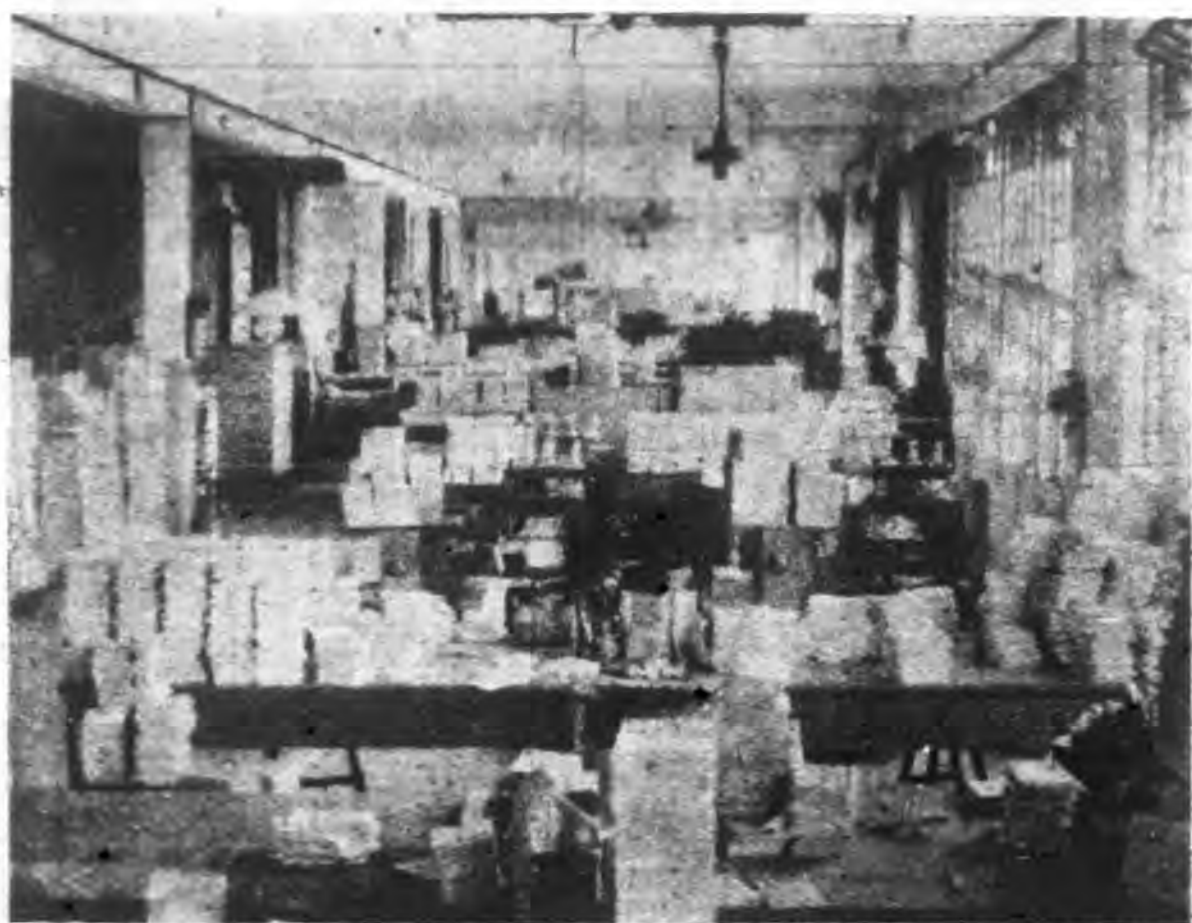
上海印刷廠訂裝精裝課