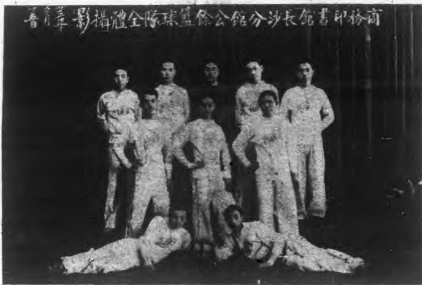
商務印書館分館沙分館餘籃球隊全體攝影