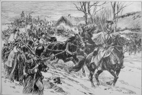
14. Колонисты, Венесуэла, вывозят урожай табака. Вязанки 20 пачек 190 г.