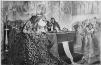
Г. Гуптара, 4-го из спектакля в Аммане Индии