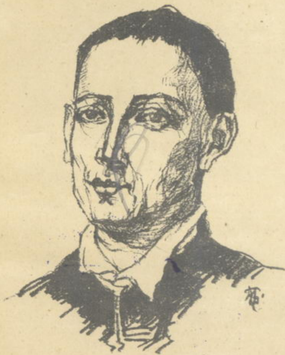
Григорій Сковорода. (1722—1794).