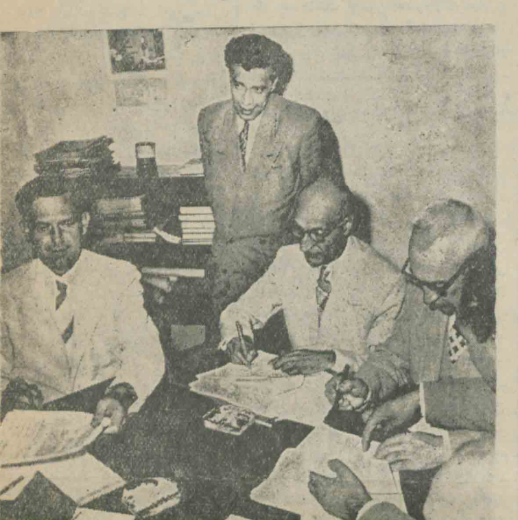
روز پنجشنبه قراردادی برای ایجاد کارخانه تصفیه آب ببلغ یکمیلیون و ۷۰۰ هزار دلار بامضای نمایندگان اصل چهارم و نمایندگان ایران رسید: در این عکس وزیر بهداری و وادان هنگام امضای قرارداد دیده میشوند

این هفته (ژان دو گلو) لیدر حزب کمونیست فرانسه بجرم تحریک مردم به تظاهرات محاکمه خواهد گردید