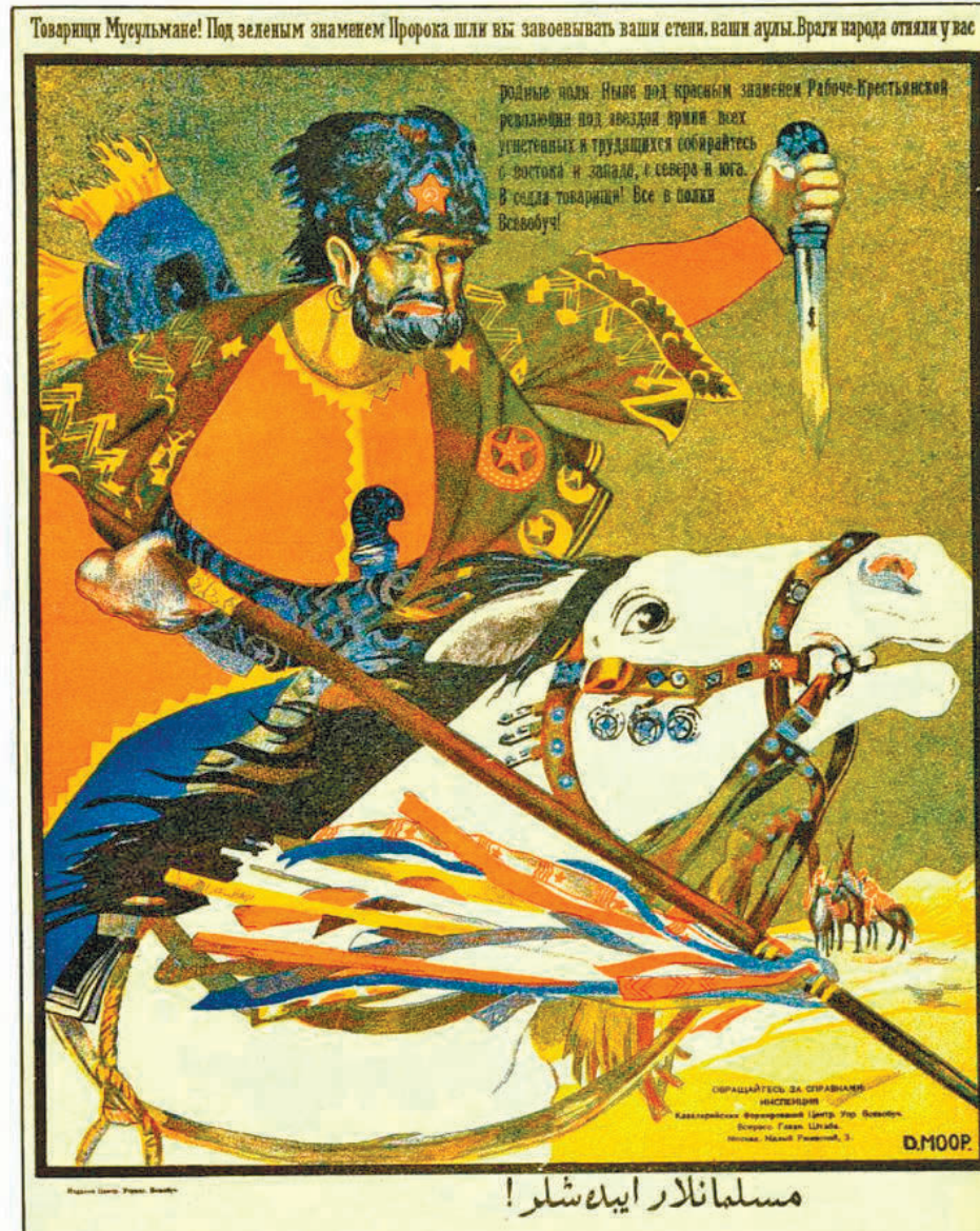
Плакат із закликом до мусульман приєднатися до більшовиків