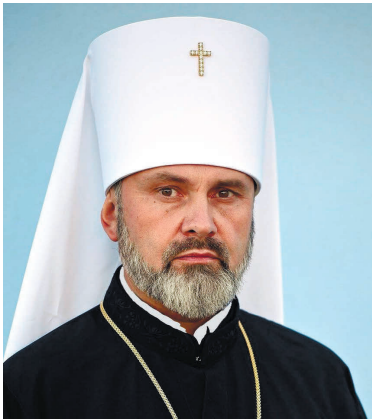
Митрополит Сімферопольський і Кримський ПЦУ Климент