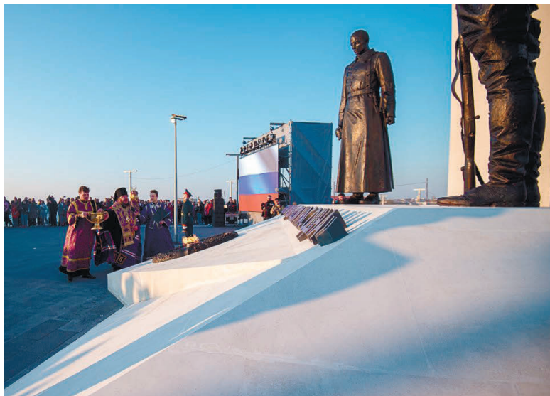
Єпископ Калінік освячує пам'ятник «жертвам громадянської війни» в окупованому Севастополі.

ного двічі – спочатку німецькими, а потім радянськими окупантами.