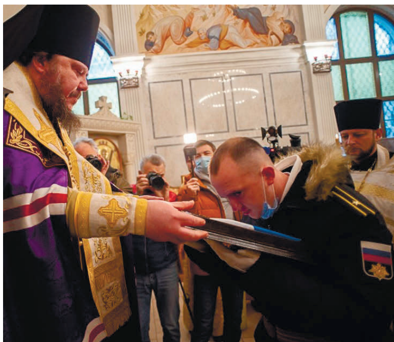
Єпископ Калінік освячує прапор для нового малого ракетного корабля ЧФ РФ «Грайворон» в окупованому Севастополі.

На початку 2016 року митрополит Онуфрій зробив заяву про те, що УПЦ МП є «єдиною церквою, яка не розділила Україну і тримає під своєю владою Крим і Донбас»; при цьому він звинуватив представників української влади та суспільства в тому, що вони «поділили Україну» та «довели її до такого стану, що і Крим відпав, і Схід дихає на ладан» – тоді як УПЦ МП «робить усе, щоб зберегти цілісність України». Втім, вже за кілька тижнів він благословив призначення вікарним єпископом Сімферопольської і Кримської єпархії скандально-