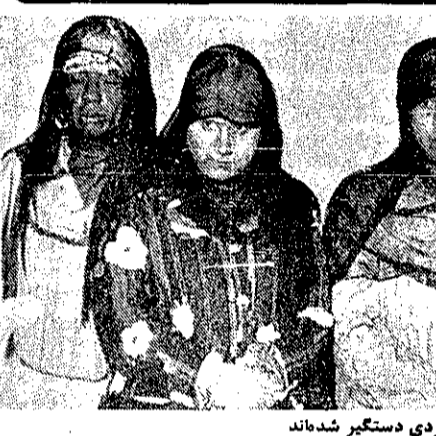
۵ زن عرب که به اتهام دزدی دستگیر شدند

مشهد - خبرنگار کیهان - پنج زن عرب با اتهام سرقت از دو جواهر فروشی دستگیر شدند.