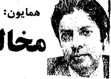
همایون: مخالفان باید موضع خود را روشن کنند