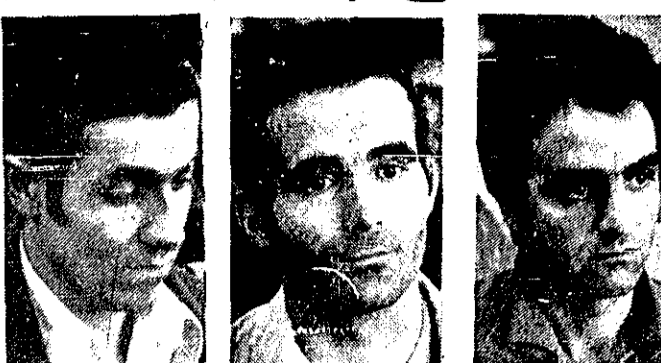
۳ تن از کسانی که به اتهام تخریب شهرداری منطقه محکوم شدند