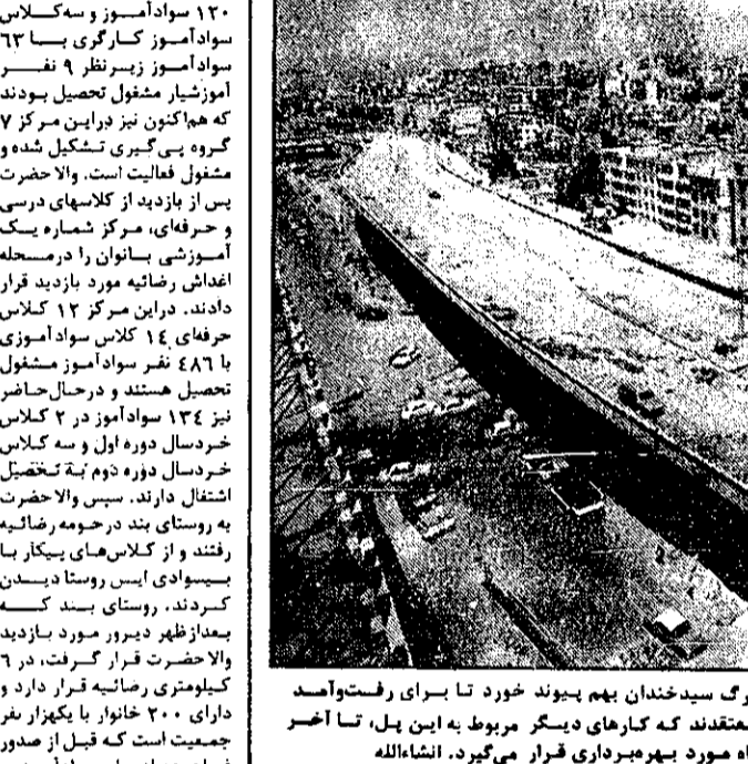
سرتانجام پس از چندسال قسمت‌های پیش ساخته پل بزرگ سید خندان بهم پیوند خورد تا برای رفت‌وآمد اتومبیلها مورد استفاده قرار گیرد. مقامهای شهرداری معتقدند که کارهای دیگر مربوط به این پل، تا آخر مرداد ماه به پایان میرسد و از این طلسم شکست، در همین ماه مورد بهربرداری قرار می‌گیرد. انشاءالله