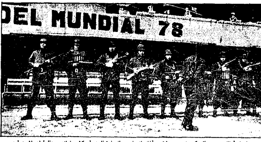
ارتش آرژانتین، در حالی که چند روز پیش به آغاز بازیهای جهانی فوتبال در آن کشور نموده، بحال آمادهاش درآمده است. این عکس از استادیوم روبرولات در بوئنوس آیرس بر داشته شده است.

عملیات فرانسه و سلاویک طیارهها به نجات سفید پستان بام افاده در زئیر و باطن برای گسترش نفوذ نظامی و اقتصادی غرب در آن منطقه بوده است. شوری و کوبا هر دو ادعای آمریکا و کشورهای غربی را مبنی بر اینکه کوبانیها به شورشیان کاتانگایی کمک کرده اند تکذیب کرده اند.