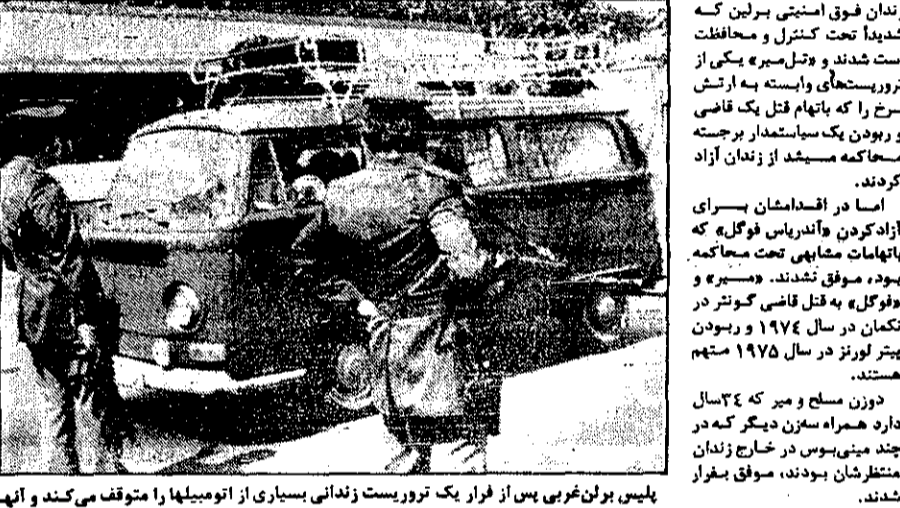
پلیس برلین غریبی پس از فرار یک تروریست زندانی بسیاری از اتومبیلها را متوقف می کند و آنها را بازرسی می کند.

برلین - آسوشیتدپرس - دوزن مسلح که او را اسیریت جعلی همراه داشتند دیروز وارد زندان فوق امنیتی برلین که شدیداً تحت کنترل و محافظت است شدند و در آنجا یکی از تروریستهای وابسته به ارتش سرخ را که با نام قتل یک قاضی در ویدن یک سیاستمدار برجسته محاکمه میشد از زندان آزاد کردند.