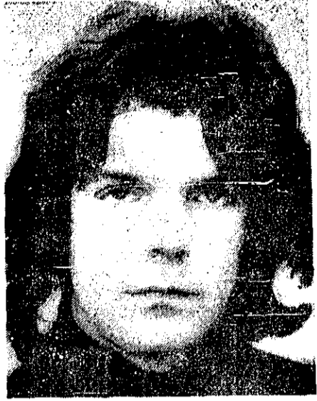
تیلیر - تروریست آلمانی که از زندان فرار کرد (رادیو فریوی اوسلیندرس)

مهاجمان یک تروریست معروف آلمانی را از زندان فراری دادند