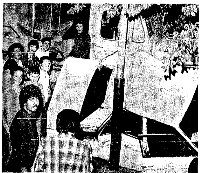
صحنای از برخورد تانکراتو میلی با اتومبیل سواری

یک تانکرت کوش دیشب هنگام عبور از خیابان شریعور شید تهران سمت چپ جاده منحرف شد و یک اتومبیل سواری را که در کنار خیابان پارک شده بود، درهم کوبید و خساراتی بهار آورد.