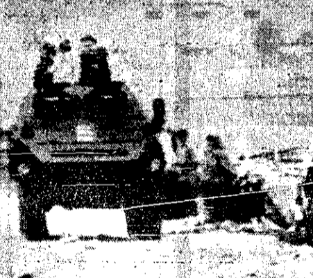
یک روزنامه همچنین اضافه کرده است که دخالت شوروی در شاخ افریقا و دیگر کشورهای شبه جزیره عربستان و اقیانوس هند باید مشدداً باشد به شوری کوچک این مناطق.