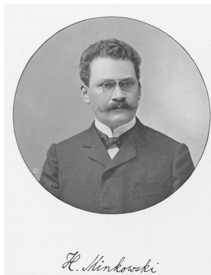
Hermann Minkowski (1864-1909)

DEFINITION 40.1. Ein reeller Vektorraum der Dimension n mit einer Bilinearform \langle -, - \rangle vom Typ (n - 1, 1) heißt Minkowski-Raum .