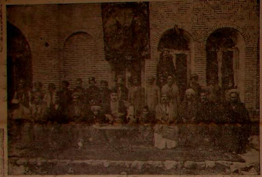
سلطنت سيمك ايران داخلده سنه شهرى باش شهيد خواجه مده و اذات حضرت خلافتناهي بمصادق يوم مسوده اجرا قللان مراسم

نخستى ۲۰ باره بدر شديدك هفتاده بر دفعه نشر اولور .