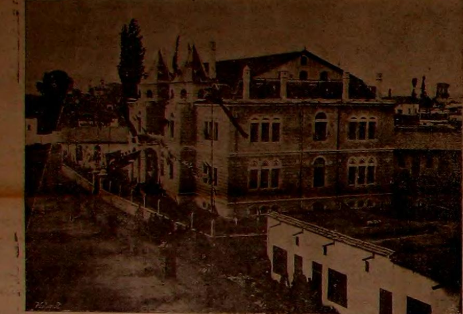
سایه معارف و ابیه حضرت خلاقیتنا هیده قوشیده مجدداً انشا اولتان مکتب صنایعک باغچوسی

موسی الیک مدی کاز غلغریه سبق صیق کیروب جقمده اولدیندن اون ایکنی صحرک اولتریمه طوغری عربلرک بدازمسنده بولان « بوجیا » بلده سنه قونوس مقیبه اعزام ایتمش اولدیندن « وقوه بیوک بر استمداد وهراتی تقومه اسول تعداد ورقیسی مکمل تعلیم ایندیجی شدی . « ایتالیاه عودتده ( ۱۲۰۲ ) اولدینتی abaci liber حاضرین مقصل تف ایچون کله