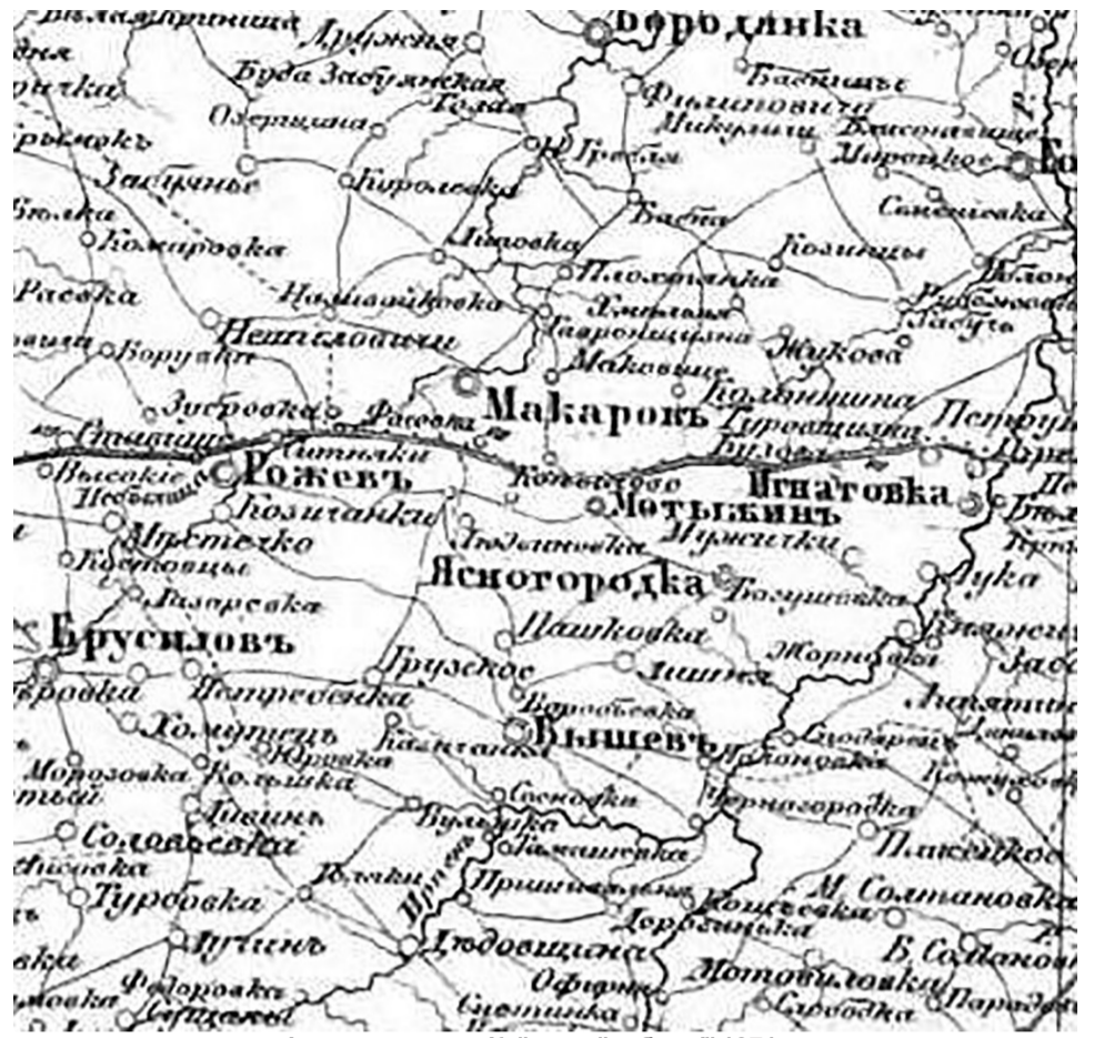
Фрагмент карти Київської губернії 1871 року.

Маєтки, що перебували в казні – Рожівський у