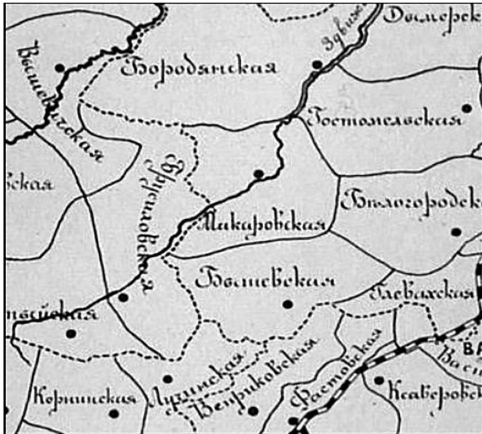
Фрагмент карти волостей Київської губернії. 1890 рік.

Гавронщина, Липівка, Коропівка і Андріївка – до Першого стану Київського повіту з центром у м. Гостомелі; містечка Макарів, Мотихин, Бишів, Ясногородка, села і хутори Северинівка, Колонщина, Маковище, Забуяння, Фасівка, Буда Поташова, Кодра, Соболівка, Завалівка, Наливайківка, Юрів, Коптіївка, Червона Слобода, Великий Карашин, Малий Карашин, Фасова, Людвинівка, Копилів, Красногірка, Плахтянка, Горобіївка, Пашківка, Грузька, Гімовка, Юрівка, Вульшка, Козичанка, Соснівка, Лишня, Леонівка, Мостище, Новосілки – до Другого стану Київського повіту з центром у м. Гнатівка; містечко Рожів і села Ніжиловичі, Небелиця, Ситняки, Борівка, Комарівка, Рудня Комарівська, Гута Комарівська, Рудня Ніжило-