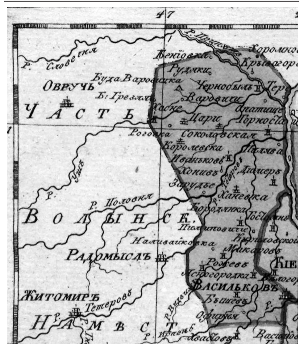
Рожівський округ на карті Київського намісництва 1795 року.

Радомисльському повіті і Веприківський у Васильківському (до якого входили Чорногородка і Яблунівка) були перетворені на волосні центри пізніше, в 1866 році.