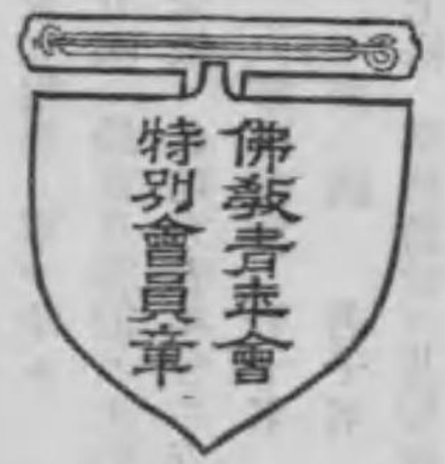
「佛教青年會 特別會員章」 浮文字

正會員ハ銀色、特別會員並ニ名譽會員ハ金色トス 第七條 本會ノ役員ハ會長、加談、幹事、錄事、評議員等ヲ置キ以テ一切ノ會務ヲ評議處理ス