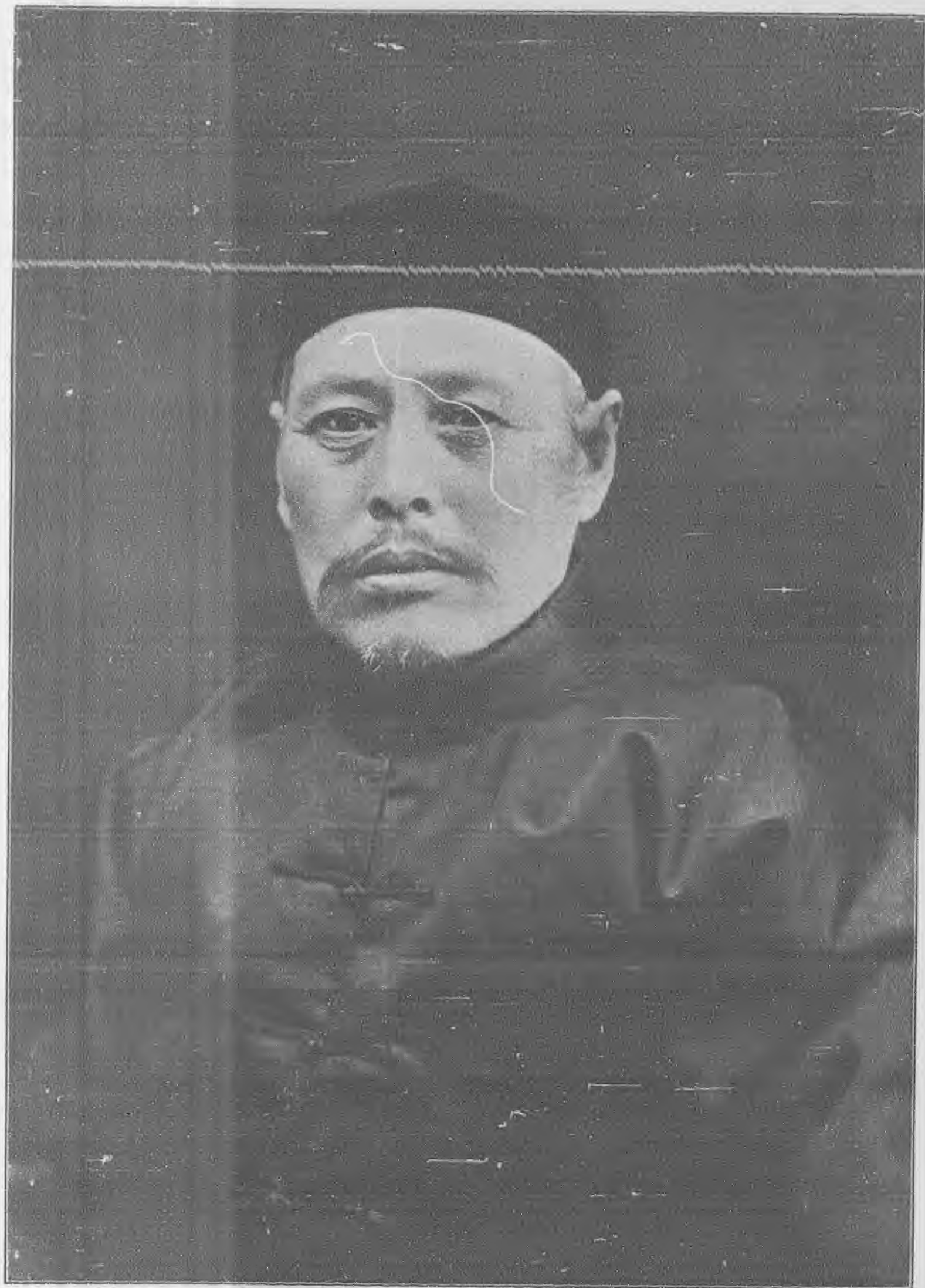
影攝近最生先玉子吳之字寫書讀平北居閒