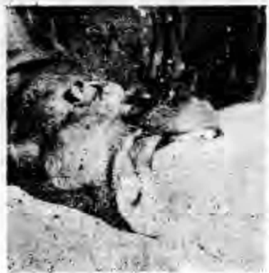
河馬張嘴了！ 巴黎花叢動物園新法。見所圖物動森花黎巴

性了人孤情即接來 也進步強非舞自 跳已入，烈華等波 舞經一配合商，蘭波狂戰了 也便彈以有滋道的關舞爭， 不揚自來原也些希，上第 成男場自始少雍希米以人迷 爲子一美性人容舞亞前們古 一平沒洲的跳高~的風愛風大 許等以人術而的蘇步的刺不 得利請的，逐舞格舞波激存後 如已講爵如滿術蘭~爾，在， 何無過禮常戈行給輕馬黎經 重去節樂，的放盈左，大過不 的的的，瓜是舞舞加~多了不 事神，年叶些了和舞來日踐相 了秘女青，感，穿~自夜酷同