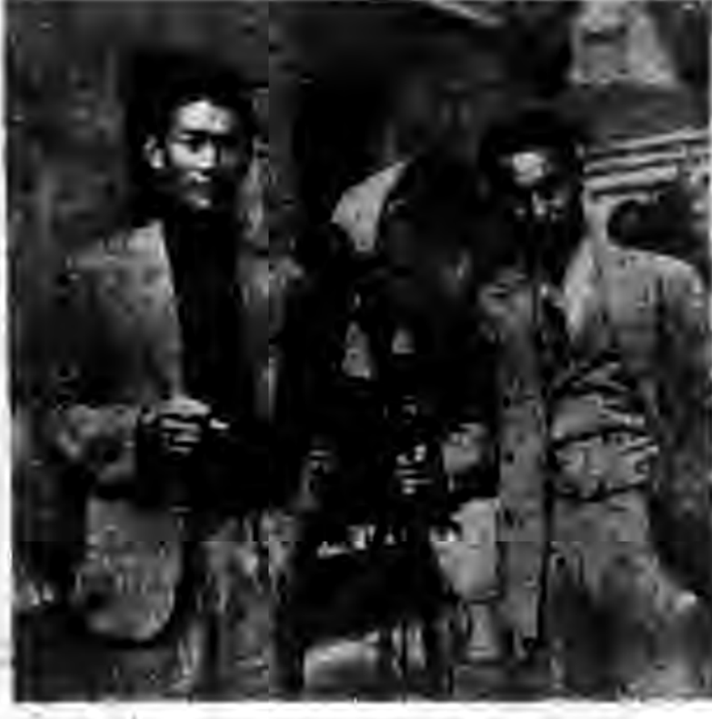
影合天添謝與羅保李人劇名。

成命明辰 功望燈飯 了蟹，店？ ！豈表？攝 圖銀示攝圖保 為壇立影珍是難 京，志時貴他也謝 石現在藝，影二了現 贈在藝，影二了現 刊呢術面，人前成 。？界前地十輩了 謝成攝點五標紅 。話名著大前劇星 某已尤架是的人， 。經其照北一右李