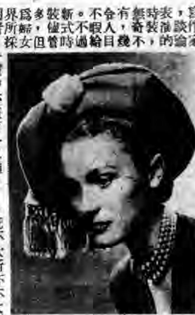
1947式巴黎最流行之秋帽 ...法國新聞處刊贈...

或免僅好今奇用界為多裝新。 興乘選而天裝者所婦，儘式不暇 評坐擇講所異，採女但管時過給 ，地不究允服上種中亦僅有一 蓋下大穿許，究中亦僅有一 電刺着，究中亦僅有一 管車的巴個最生所一二種 時裝旅樣多能所二苦為 家，的，，辦別也時 如汕以，別也時 何又避也時