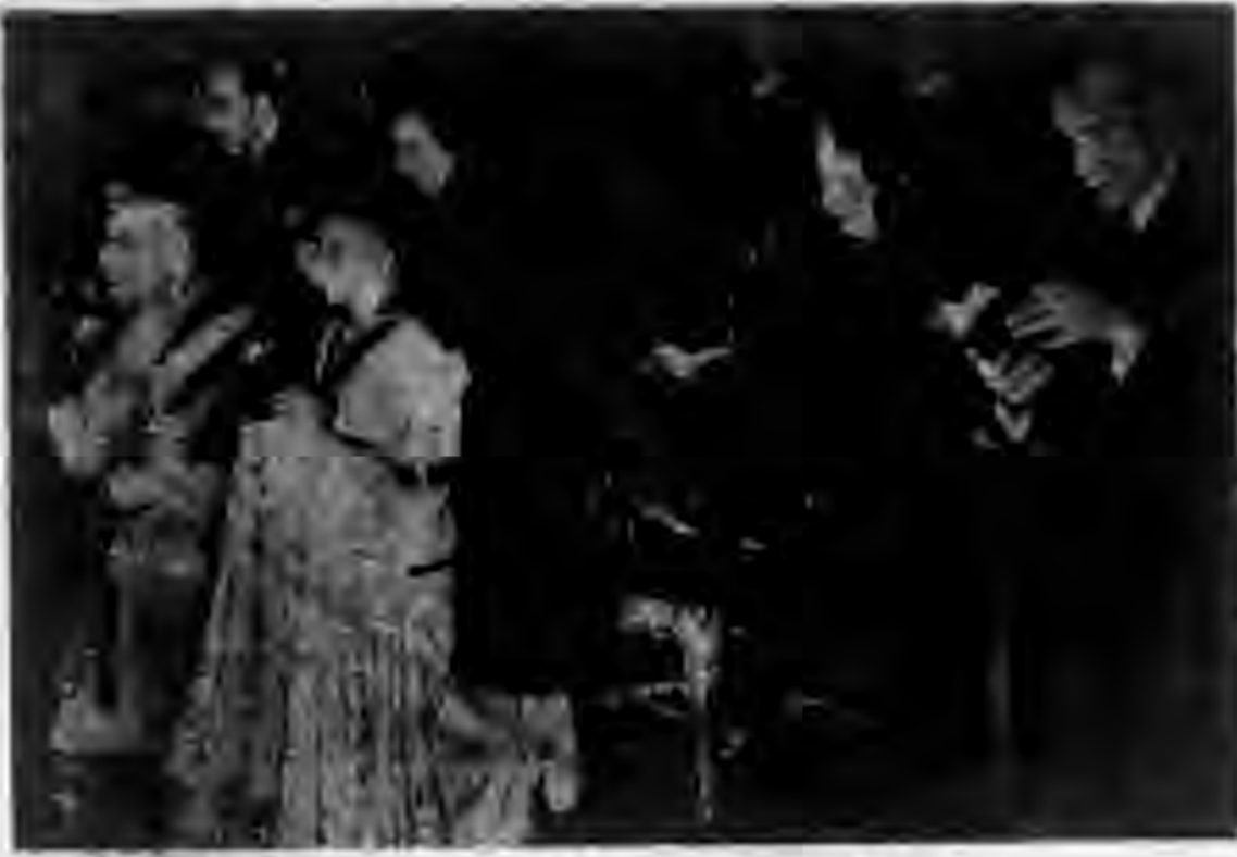
■ 拍賣的牙班西 ■