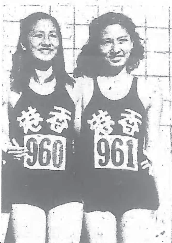
《生婉黃珍婉黃魚人美新》

局，警男排球錦標賽，上海對警察，雙方作殊死戰，終場，局長即大呼「快送可口可樂去」。