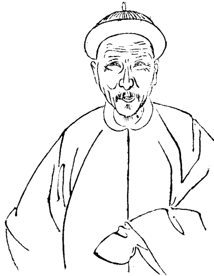
源 一 公