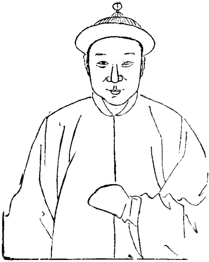
配 京 公