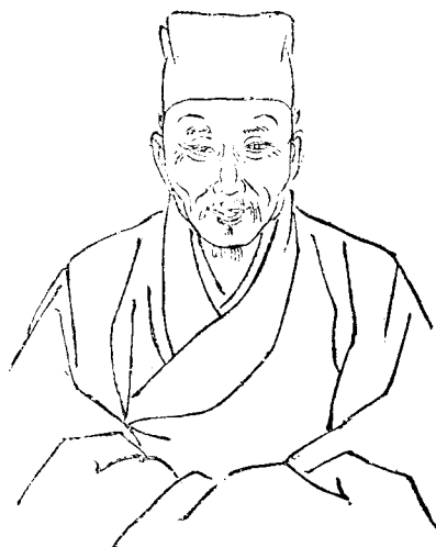
公 凡 豫