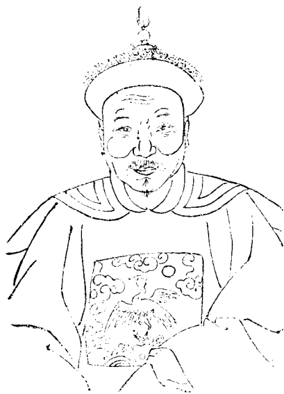
公 宸 拱