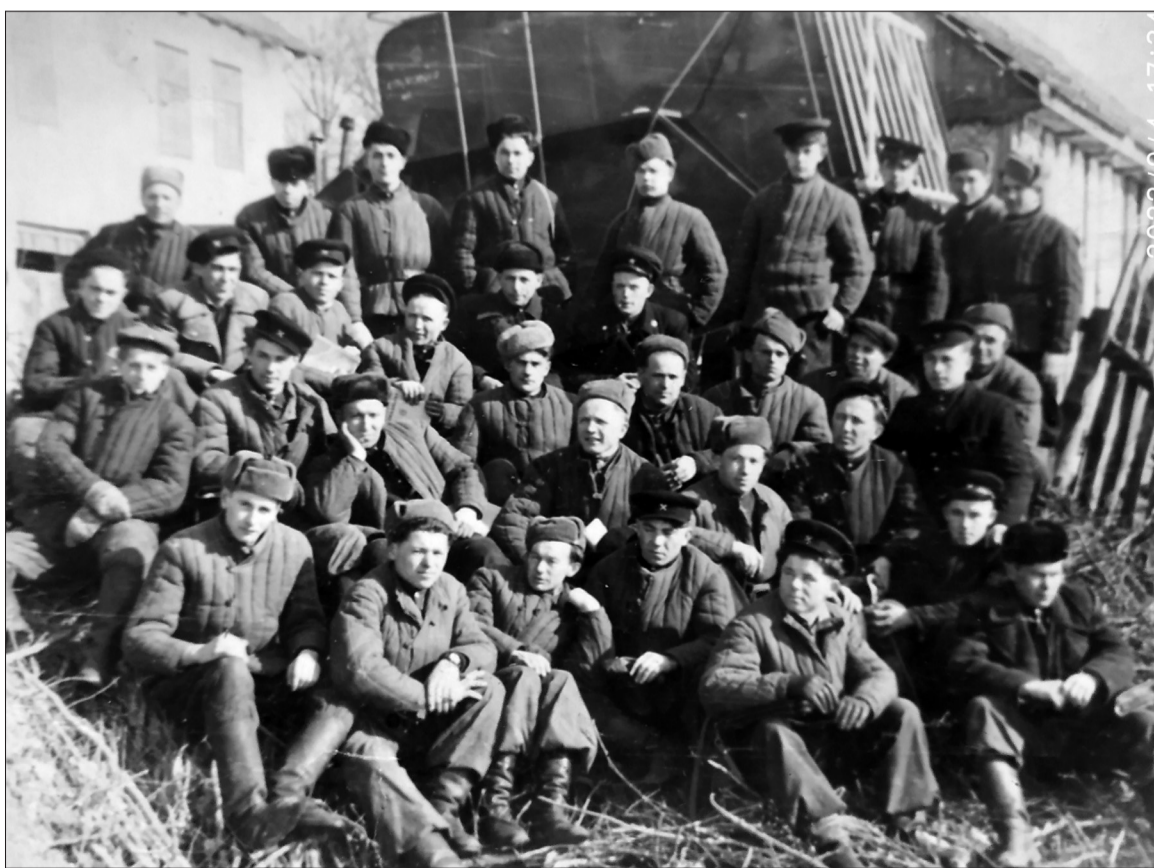
У школі механізації, м. Кременець, 1955 р.

На ходу тато розповів нам історію, яку не забути ніколи. Він