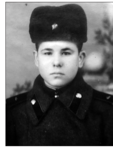
Військова повинність в Хабаровському краї, 1952 р.

Птаха прилетіла перед самим ранком. Невидима за сивим туманом, вона раптово стукнула дзьобиком у шибку і полетіла на татову яблуню під вікном. Її несподіваний приліт стривожив, але щебет з яблуневої гілки заспокоїв, як подорожник. Пташка прилетіла і наступного ранку, і знову, і ще. Через декілька днів я вже виглядала її у світланкових сутінках, щоб разом зустріти сонце. Сто разів перед тим, піднявшись з ліжка, у глухій тривозі, з надією дивилася у вікно: “Пташко, де ти?” І ось її невидимі лапки на склі, і чистий голос заливає сад.