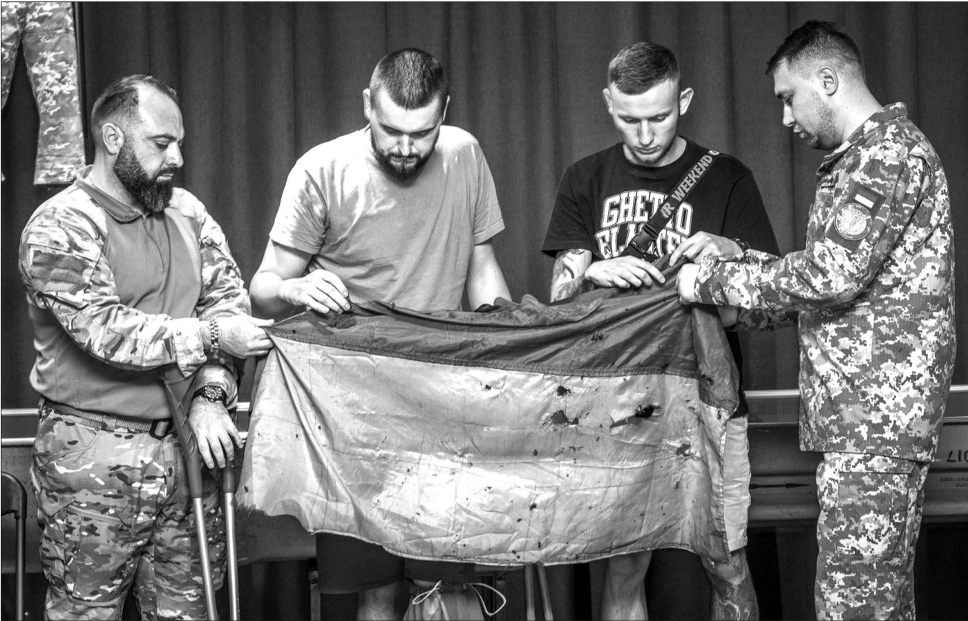
Захисники Маріуполя передають на довічне зберігання свій прапор з "Азовсталі" до експозиції "Україна – розп'яття". Прапор зберігатиметься в Національному музеї історії України у Другій світовій війні.