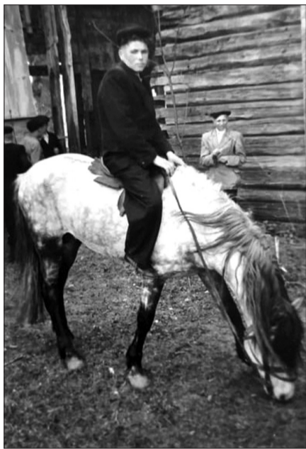
На коні “в яблуках”

ма: ніч пережили, ще один, відпущений небом день попереду.