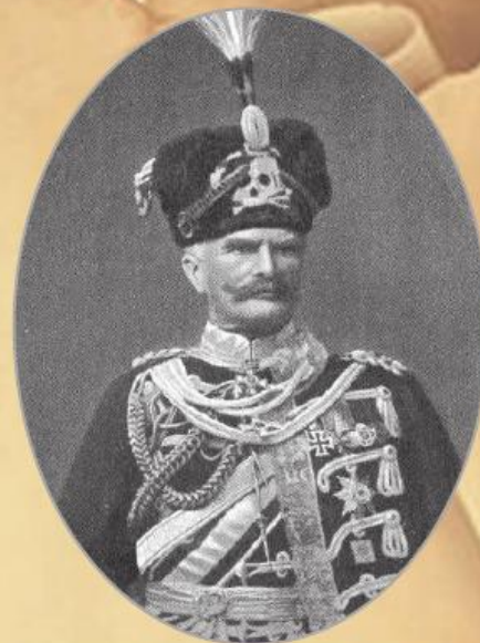
«Мертва голова» на військовому головному уборі пруського генерал-фельдмаршала Августа фон Макензена (поч. XX ст.)

В роки Першої світової війни «Мертва голова» або ж «Totenkopf» стала емблемою елітних штурмових частин німецької армії, вогнететних рот і танкових батальйонів. У 1916 році цей символ як найвищий знак, що мав постійно стимулювати підвищення бойового духу і зневагу до смерті, вогнететникам присвоїв особисто наслідний принц. Після німецької революції 1918 року «Мертва голова» з'явилася на уніформі фрайкорів – добровольців Веймарської республіки, які боролися з німецькими комуністами. Використовували зображення черепа з кістками і в інших європейських арміях, приміром, в австрійських штурмових батальйонах. А болгарський бойовий орден «За хоробрість» мав особливу ступінь – «З черепом». Власне, фрайкори, що спочатку складали основу СС, і привнесли з собою «Мертву голову» в якості головного символу цієї печально відомої організації. Заради справедливості варто додати, що есесівці обрали «Totenkopf» не з метою залякування ворогів. За словами британського військового історика Робіна Лумсдена, німці сприймали її передусім як істо-