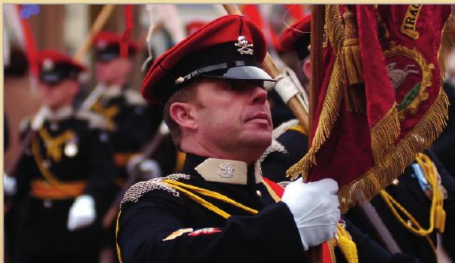
Військовослужбовець Власного Її Величності Королівського уланського полку в парадному однострої

Після Лютневої революції 1917 року російська армія перебувала в занепаді – війська були деморалізовані, а дисципліна знаходилася на низькому рівні. Намагаючись уникнути повної катастрофи, Тимчасовий уряд створив так звані «ударні частини», «частини смерті» та «революційні батальйони», які мали своїм прикладом надихати менш стійкі війська і тим самим утримати фронт. Найвідоміші з них – Корніловський ударний полк, який у ході Громадянської війни виріс до розміру дивізії і склав основу білої Добровольчої армії, та Жіноча бойова команда (батальйон) смерті під командуванням Марії Бочкарьової, що у 1917 році захищала від більшовиків Зимовий палац. Череп та кістки прикрашали не лише прапори, а й кокарди, погони, знаки розрізнення і шеврони ударників. Навіть був затверджений особливий знак у вигляді черепа з кістками на чорно-червоній стрічці. Цю традицію згодом продовжили козаки XV