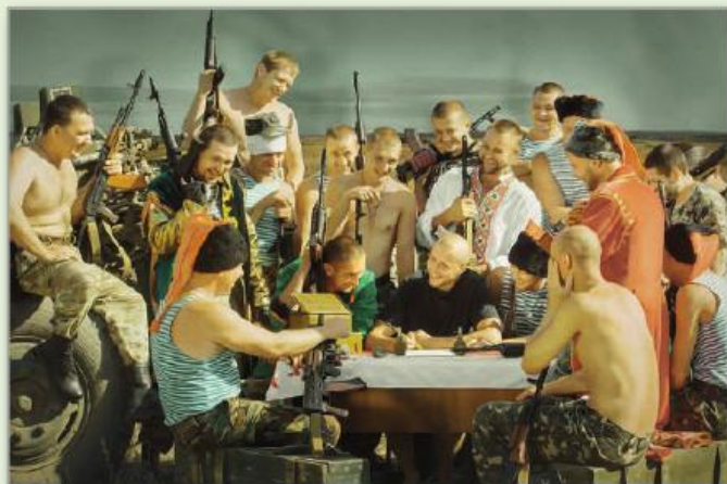
Бійці АТО пишуть листа російському «цареві»

Сидять двоє ув'язнених у Лефортовому, один іншого запитує: