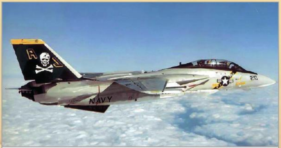
Винищувач F-14A «Tomcat» зі знаменитої ескадрильї ВМС США «Jolly Rogers» з характерним знаком підрозділу, піратським «веселим Роджером» на кілі.