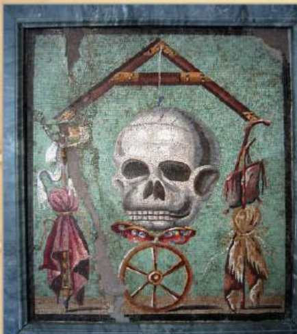
В античні часи череп використовували як символ смерті і марності буття. Цю мозаїку було виявлено в Помпеях. І хто тепер скаже, що історія – дама без почуття гумору?