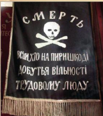
Прапор Чорної гвардії Нестора Махна (сучасна копія)