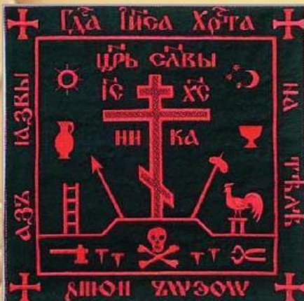
Важливий елемент одягу православного схимника – хустка під назвою параман. Центральним елементом вишивки є «Адамова голова» як символ відречення від мирського життя.

Перекручування і викривлення історичних фактів, викорінення і заперечення вікових традицій в угоду ідеології – особливості, які відрізняють тоталітарну державу від демократичної. Приміром, радянській пропаганді ми «завдячуємо» забуттю одного з найдавніших християнських та військових символів – черепа зі скрещеними кістками. Так-так, шановний читачу, ваші очі вас не обманюють. Мова йде саме про череп і саме про християнство. Розуміємо ваше здивування, адже у свідомості переважної більшості наших сучасників емблема «Мертва голова» асоціюється виключно з есесівськими карателями або ж морськими розбійниками. А от що вона означає насправді, ми зараз спробуємо вам розповісти.