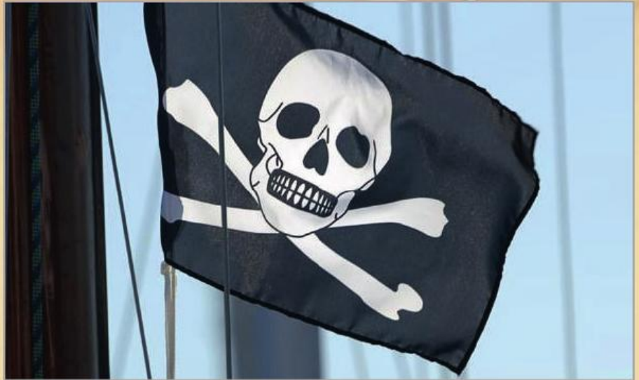
Насправді піратські судна під «веселим Роджером» не ходили – цей символ є вигадкою літераторів.

кавалерійського корпусу генерала фон Панвіца та інших козачих підрозділів, які в ході Другої світової війни воювали на боці фашистської Німеччини і входили до військових частин СС.