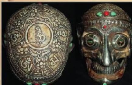
Людські кістки здавна використовувалися у східних релігійних практиках. Ритуальний предмет у тантричному вченні, виготовлений з людського черепа, називається мунда.