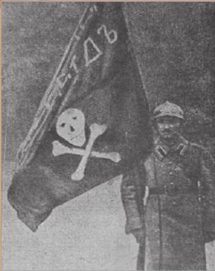
Боєць одного з ударних загонів Добровольчої армії з бойовим прапором