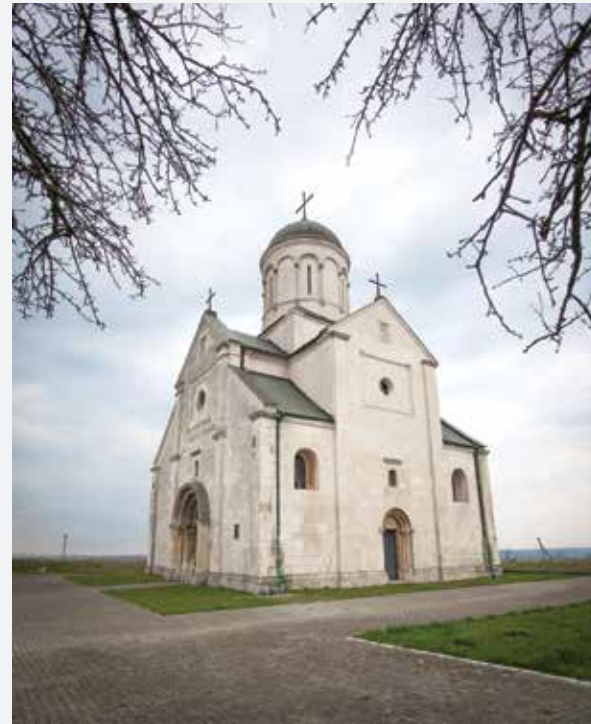
Церква Святого Пантелеймона село Шевченкове, Галицький район Saint Pantaleon Church, Shevchenkove, Halych Raion 7-е місце, найкраще фото Івано-Франківської області 2012 року Best photo of Ivano-Frankivsk Oblast in 2012

УДК 908(477)(084.12) ББК 26.89(4Укр)я6 В43